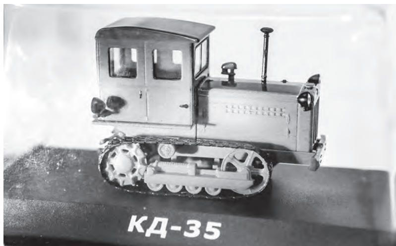
КД-35 – мощный гусеничный трактор. В историю вошел как женский. Работать на нем в послевоенное время приходилось преимущественно женщинам.

– Коллекционированием я увлекся после того, как мне неожиданно предложили купить 17 моделей. Когда приобрел их, понял, что остановиться не смогу, ведь появилась такая прекрасная возможность воссоздать историю отечественной техники, – рассказывает герой материала и показывает простую на вид копию трактора. – Это Т-74. На такой технике я начинал работать в 1990 году, в