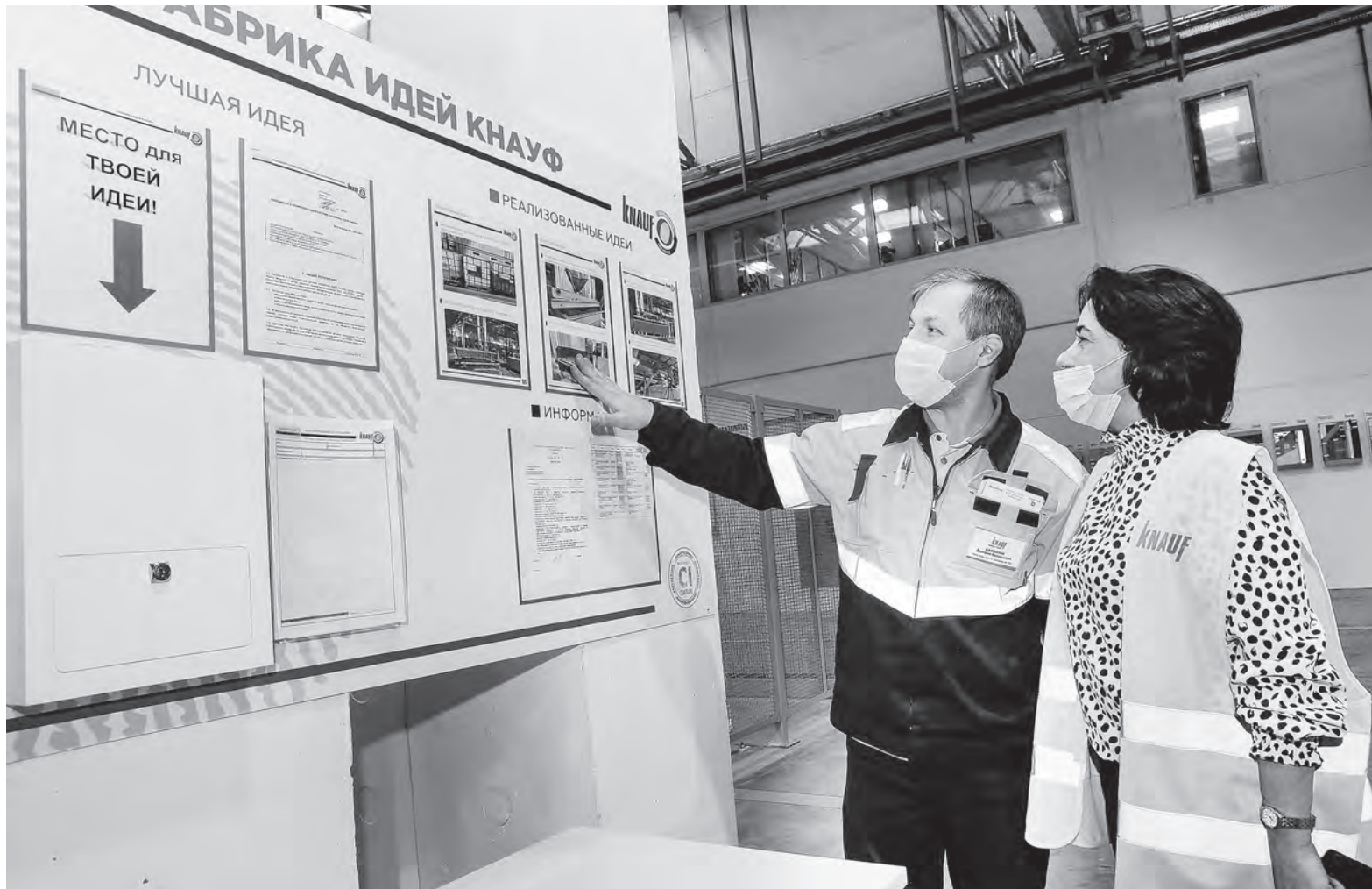
Все работники ОАО «Белгипс» могут вносить свои рацпредложения через почтовый ящик «Фабрика идей». Лучшие из них воплощаются в жизнь.

– Благодаря государственно-частному партнерству мы можем воплощать в жизнь полезные для общества проекты, – отметил он. – Например, по инициативе компании «КНАУФ» в классификатор рабочих профессий была введена профессия «монтажник каркасно-обшивных конструкций сухого строительства». Она очень востре-