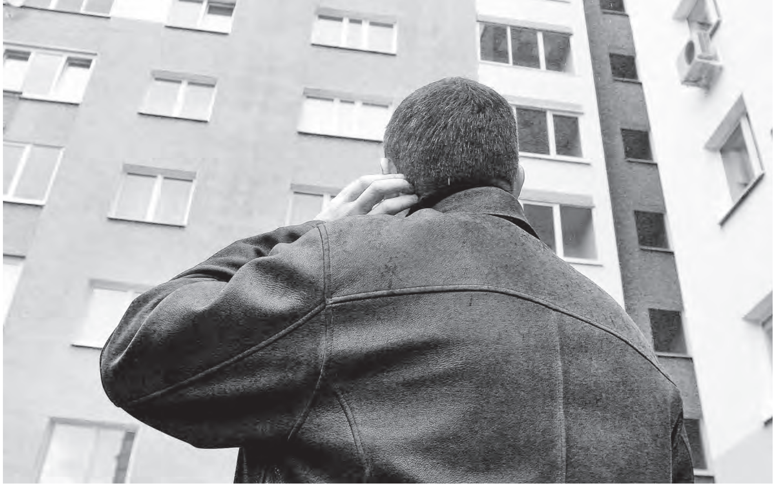
Фото носит иллюстративный характер.

▼ Работаю продавцом в продовольственном магазине и здесь же – фасовщиком по совместительству. Купили недавно с мужем квартиру. Могу ли рассчитывать на имущественный вычет по обоим должностям?