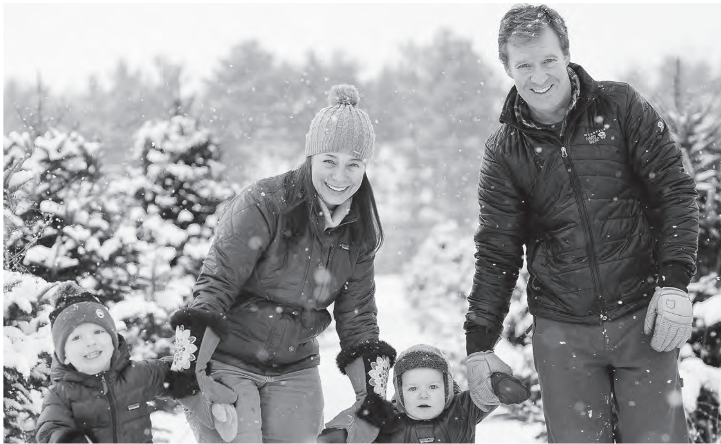
Фото носит иллюстративный характер.

Перепись населения за 2019 год показала, что в стране проживает около 1 млн. 143 тыс. семей с несовершеннолетними детьми. Социальная поддержка таких ячеек общества является основой благополучного развития государства.