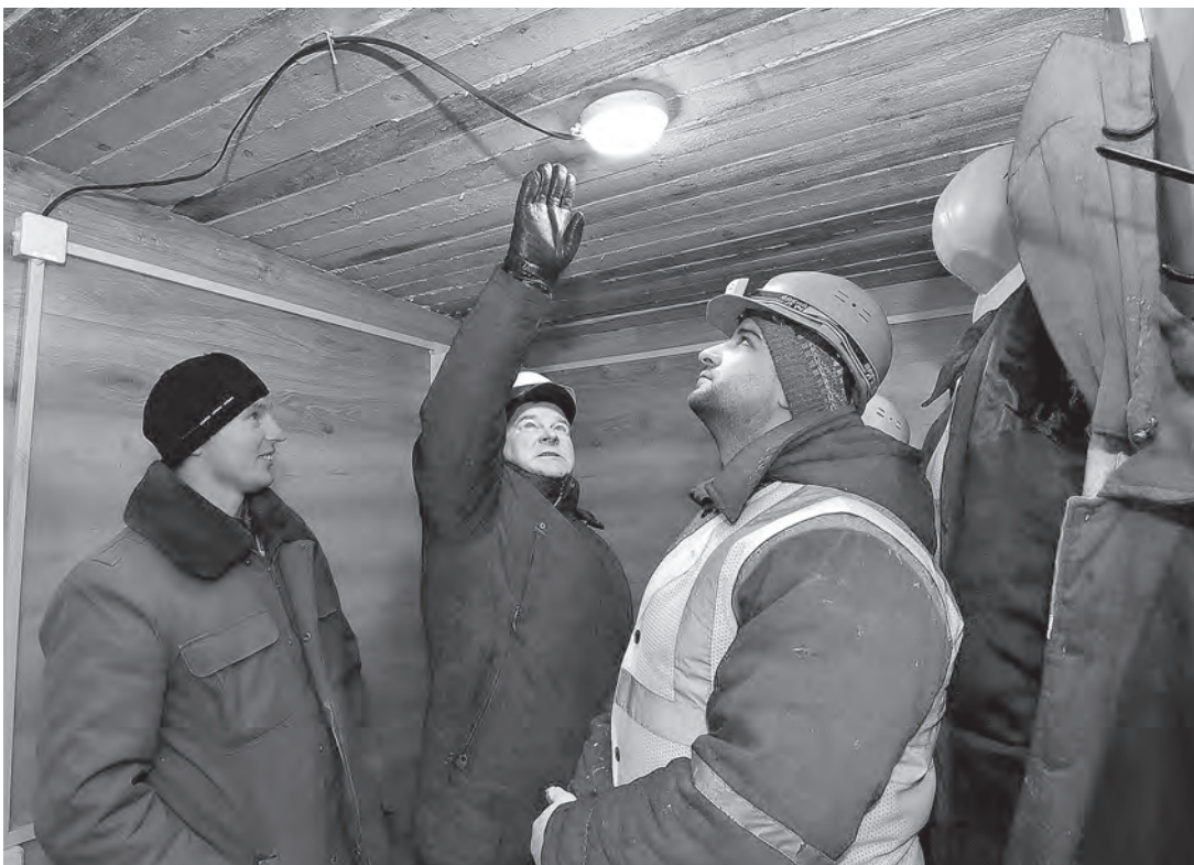
Так выглядели бытовки в одном из стройуправлений треста № 25 Барановичей в ноябре 2021 года.

Если на рабочем месте отопление технологически невозможно или экономически нецелесообразно, условия труда признаются вредными. Наниматель обязан защитить работников от неблагоприятных факторов.