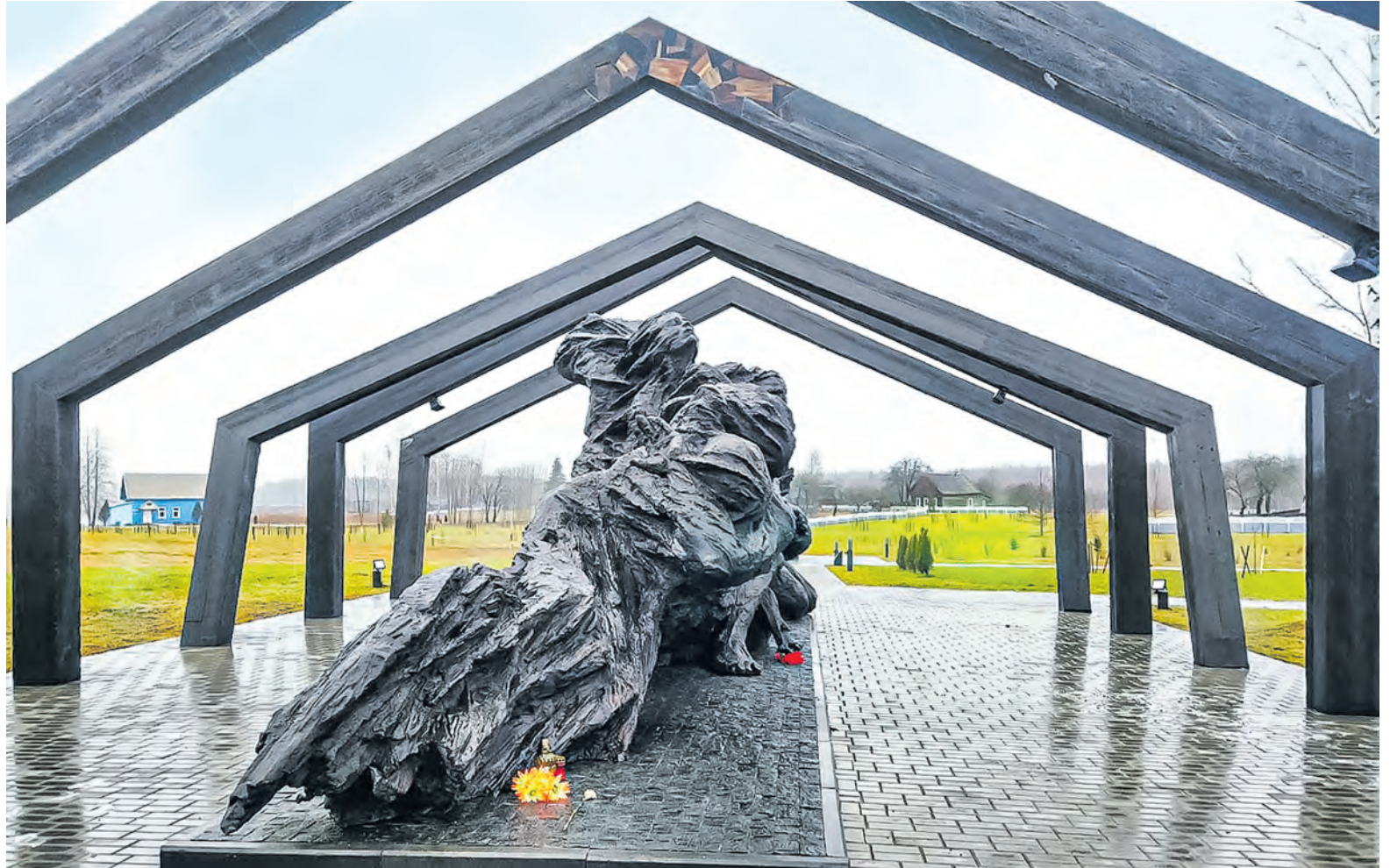
Мемориальный комплекс «Памяти сожженных деревень Могилевской области» открыли в год 75-летия Великой Победы.

В 1964 году к 20-летию освобождения Кировского района от