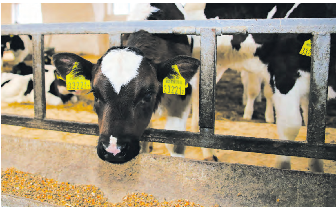
Заболеваемость молодняка крупного рогатого скота может достигать 80–100%, гибель – 25%, после прививки вакциной «БольшеВАК» показатели снижаются соответственно до 25% и 2–3%.

Еще один плюс, который гарантирует потребителю выбор