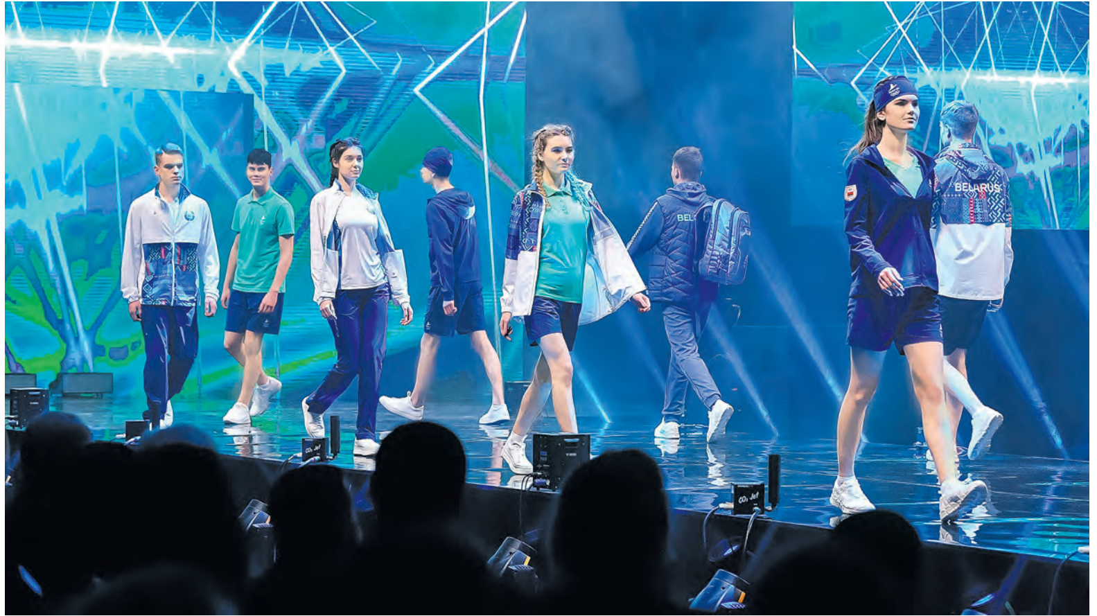
Для Олимпиады-2022 в Пекине форму сборной Беларуси придумали и сшили в Пинске.

ленные идеи в жизнь, а уже из готовых изделий отобрали экипировку, в которой спортсмены будут участвовать в высоких стартах. Победили пинчане.