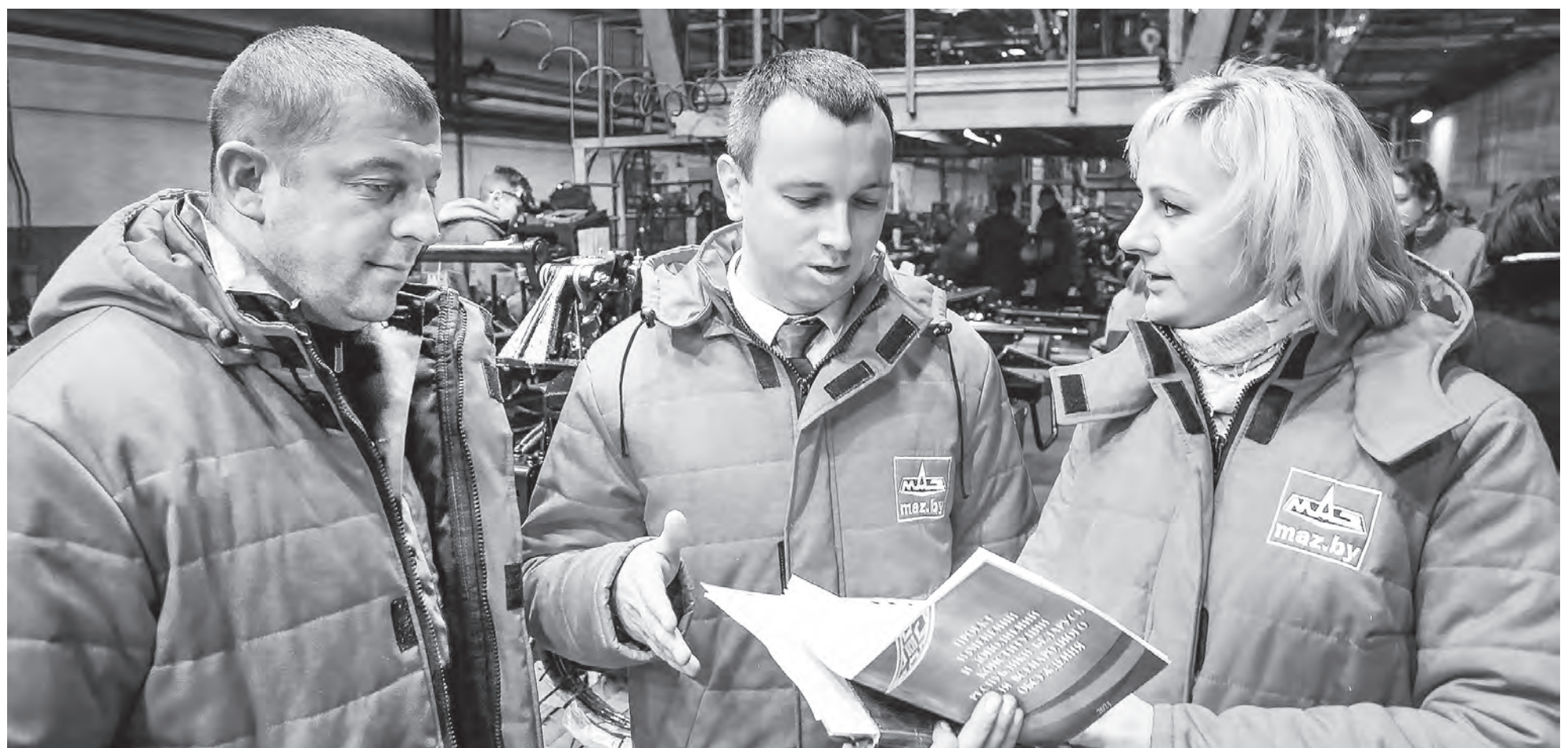
Федерация профсоюзов Беларуси организовала более 3 тыс. обсуждений проекта Конституции на предприятиях страны.