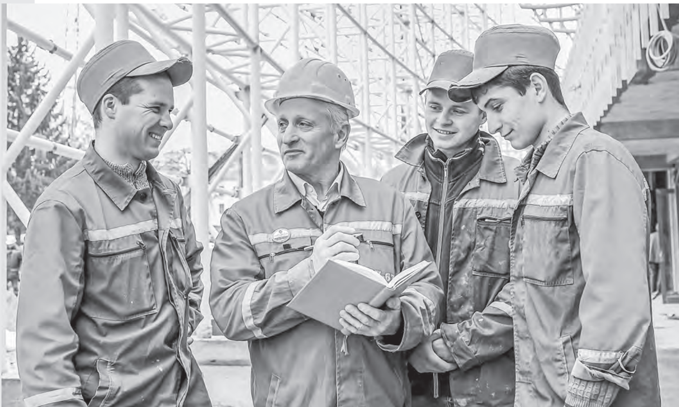
Фото носит иллюстративный характер.

Инициатива ФПБ нашла широкий отклик в обществе, к участию в ней присоединились областные, городские и районные организации профсоюзов, все членские организации ФПБ и трудовые коллективы. Гражданский проект «Мы вместе – ЗА Беларусь!» обретает масштабы общереспубликанского движения.