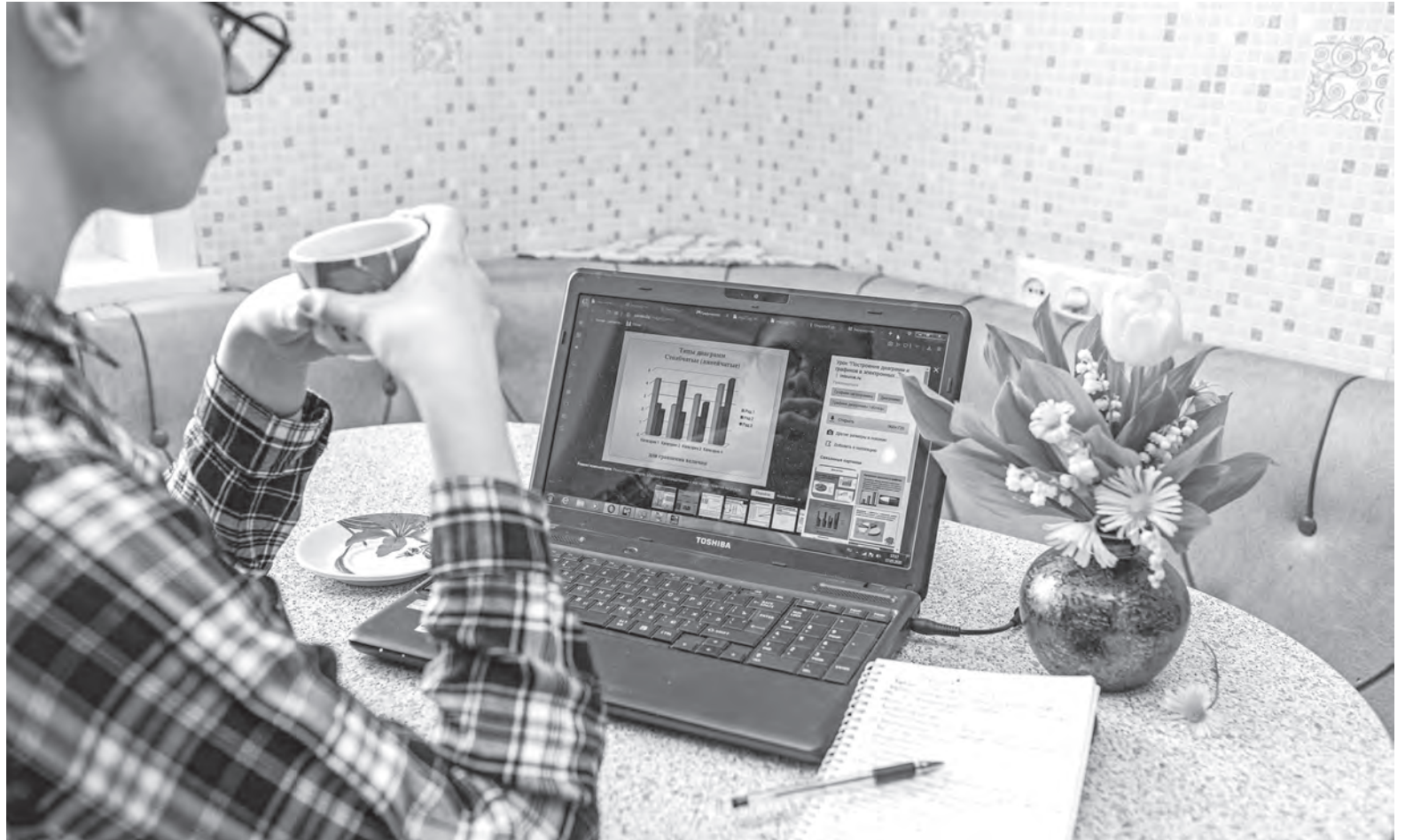
Фото носит иллюстративный характер.

Имеет ли право наниматель загружать заданиями вне рамок рабочего времени того, кто трудится удаленно? Должен ли быть обеденный перерыв у работающего вне офиса?