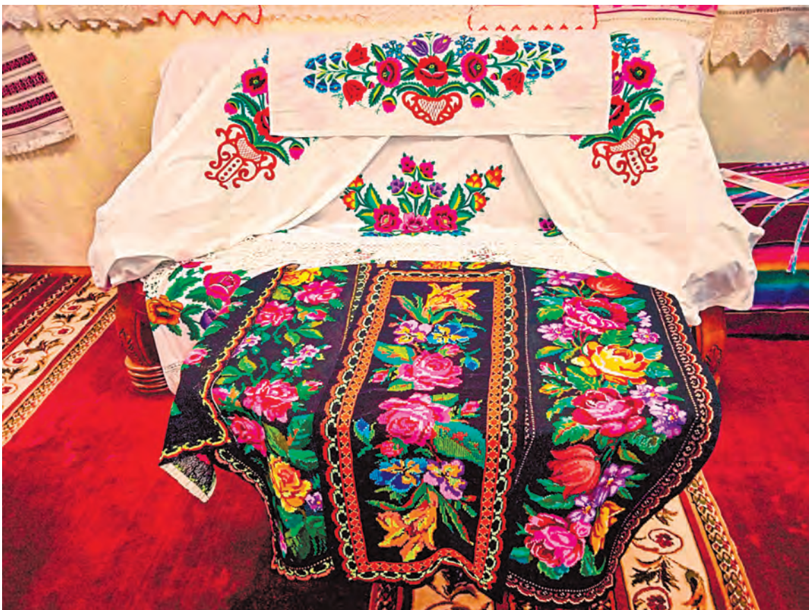
Вырабы Ульяны Віннік шмат разоў былі прадстаўлены на розных фэстах і выставах у нашай краіне і за яе межамі.

Ещё больше новостей в Telegram @belaruski_chas