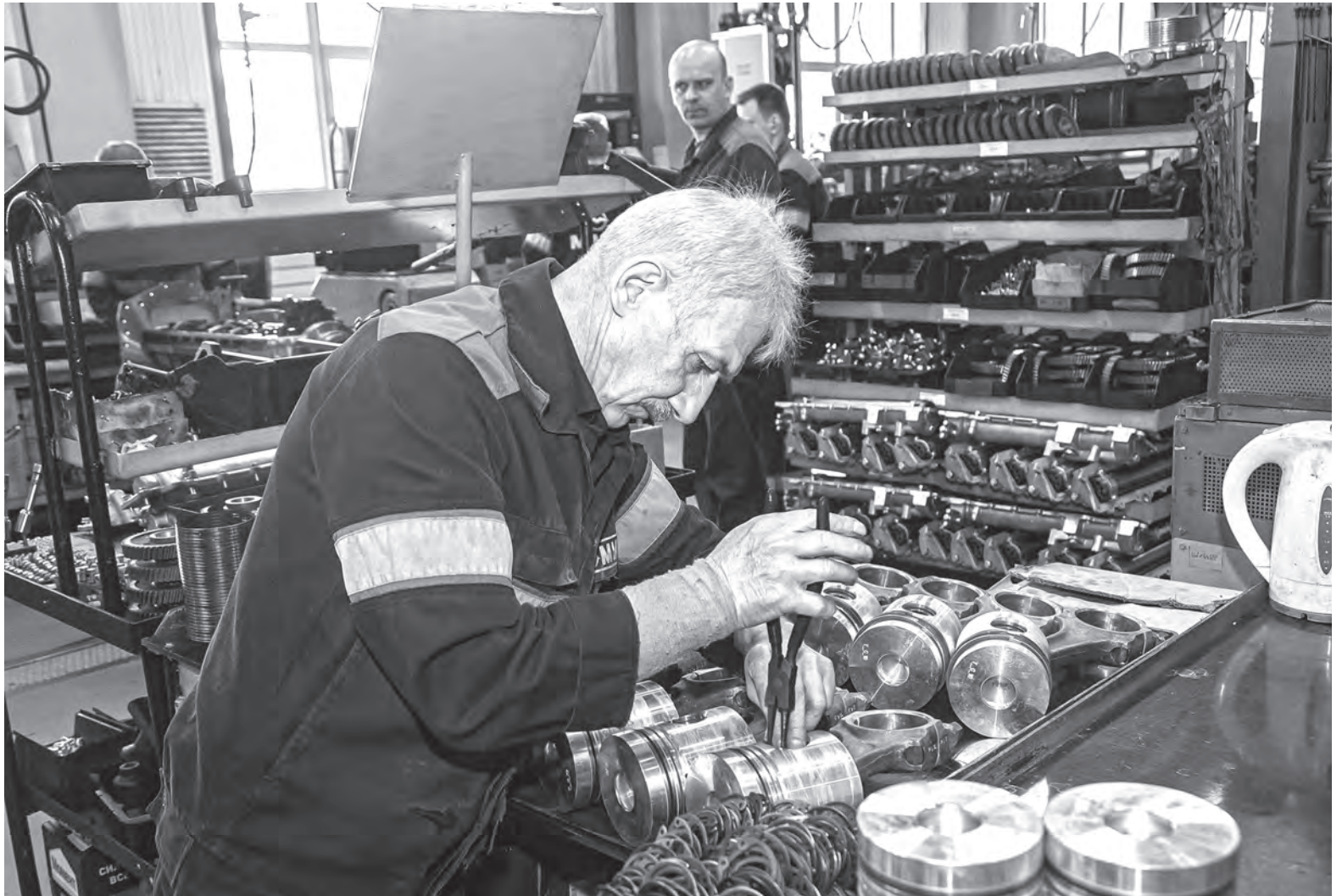
С работником предпенсионного возраста наниматель обязан продлить контракт: либо на 5 лет, либо на срок до достижения сотрудником пенсионного возраста.