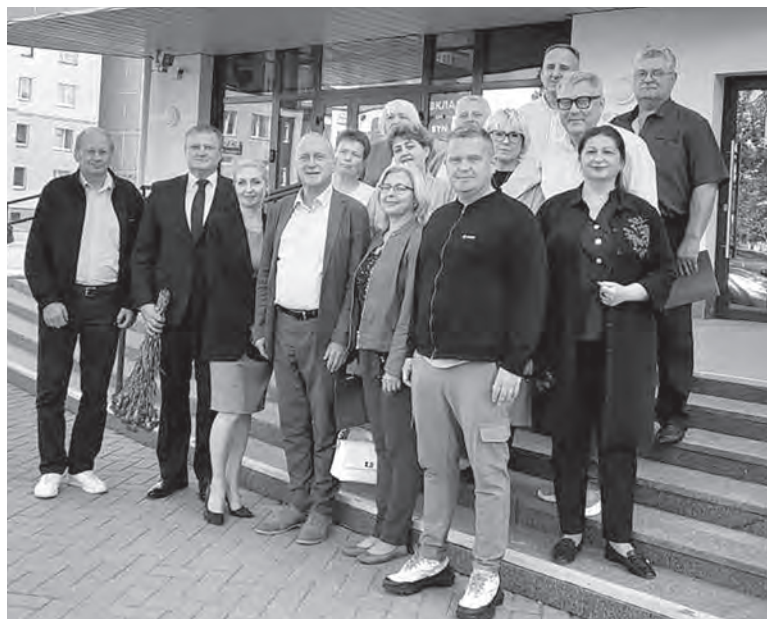
Во время выездного заседания президиума Белорусского профсоюза банковских и финансовых работников говорили о соблюдении законодательства о труде и правовом просвещении.

сфере не выявлено, – подчеркнула правовой инспектор труда. – В других организациях, входящих в наш профсоюз, где общественный контроль ведется в виде плановых проверок, дела не