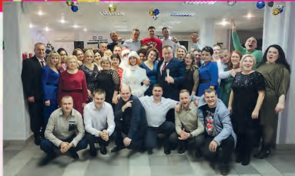
ППО филиала «АВТОБУСНЫЙ ПАРК № 1» ОАО «МИНОБЛАВТОТРАНС», Солигорск