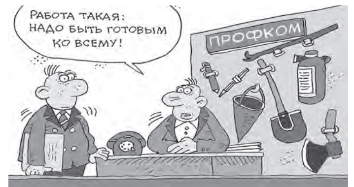
Рисунок Олега ПОПОВА