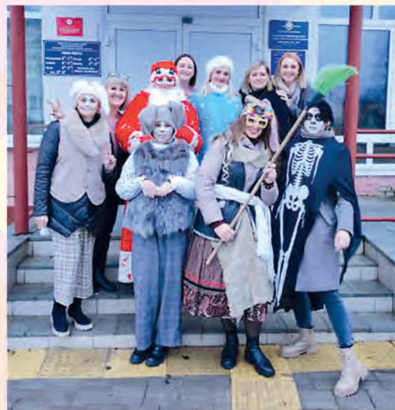
Белыничский районный центр социального обслуживания населения