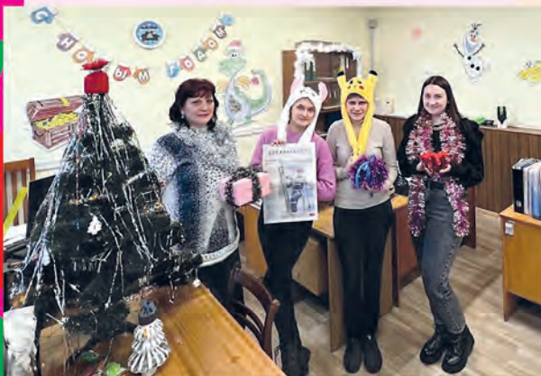
ППО ОАО «Экран», Борисов