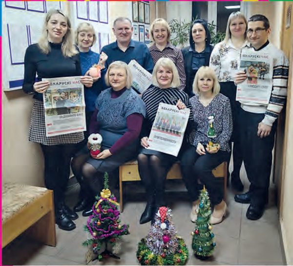
Белыничская районная организация профсоюза работников государственных и других учреждений