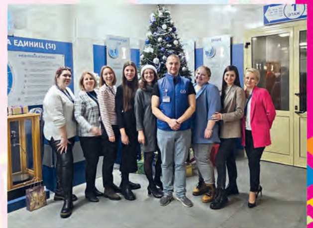
ППО РУП «Белорусский государственный институт метрологии»

Каждый победитель рекламного мероприятия «Новогодний калейдоскоп»