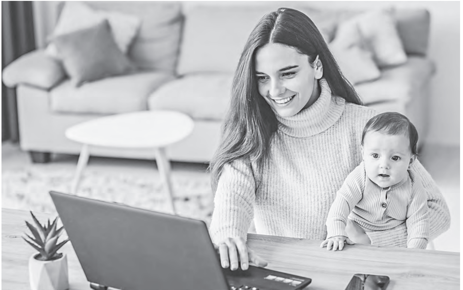
В отпуске по уходу за ребенком в возрасте до 3 лет можно подработать на условиях неполного рабочего времени.

▼ Нахожусь в отпуске по уходу за ребенком в возрасте до 3 лет и одновременно собираюсь где-нибудь подработать. Как правильно это сделать?