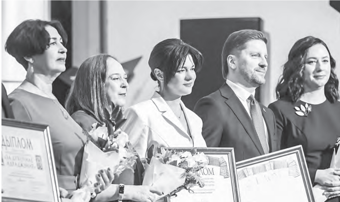
Лауреаты премии «За духоўнае адраджэнне» и специальной премии деятелям культуры и искусства на церемонии вручения.