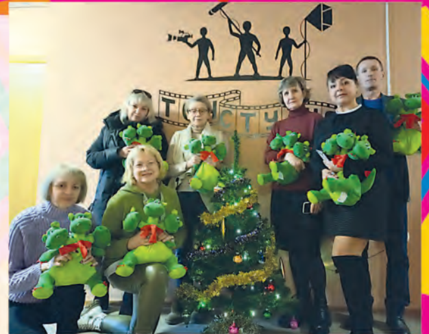
ППО УП «Национальная киностудия «Беларусьфильм»