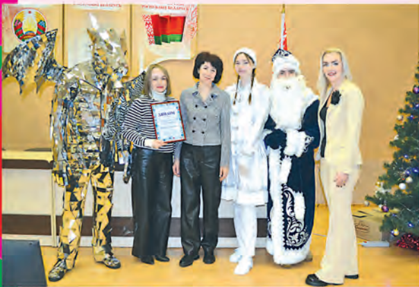
ППО УЗ «Речицкая центральная районная больница»