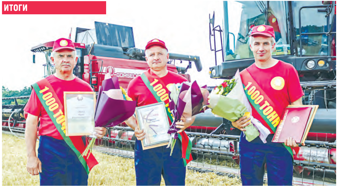
В минувшем году при проведении основных сельхозкампаний отраслевой профсоюз поощрил более 3 тыс. человек.