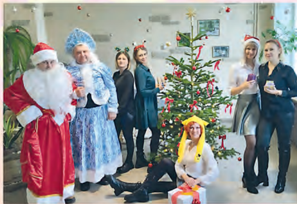
ППО ДКСУП «Красная гвоздика», Гомель