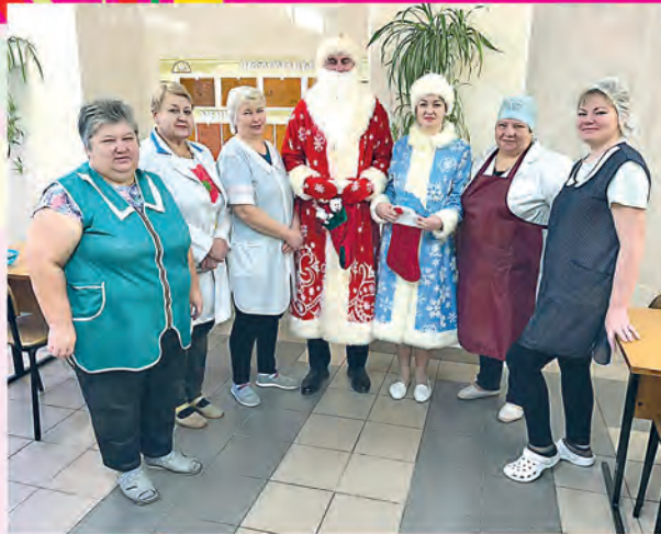
Вороновская районная организация Белорусского профсоюза работников образования и науки