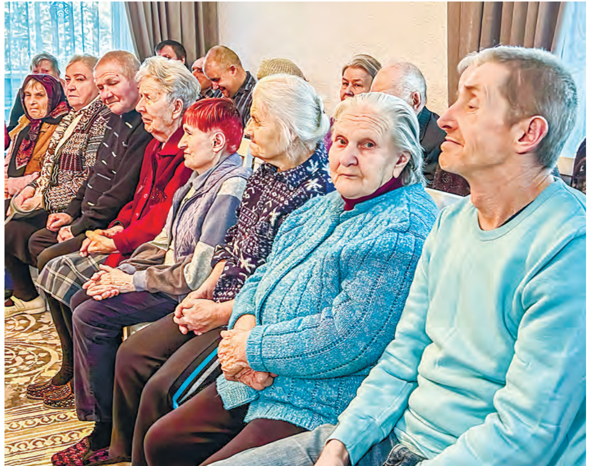
Душевную программу подготовили для постояльцев Гродненского дома-интерната в деревне Пышки.

Нужные подарки подготовили пациентам отделения сестринского ухода Могилевской больницы № 1 представители главного управления по здравоохранению области и обкома отраслевого профсоюза. Среди прочего передано кресло-коляска. Спонсорскую помощь Пуховичскому психоневрологическому дому-интернату для престарелых и инвалидов оказали