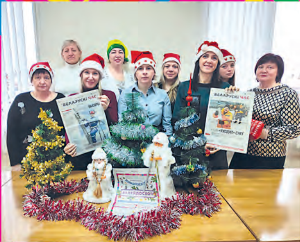
Белыничская районная организация Белорусского профсоюза работников агропромышленного комплекса