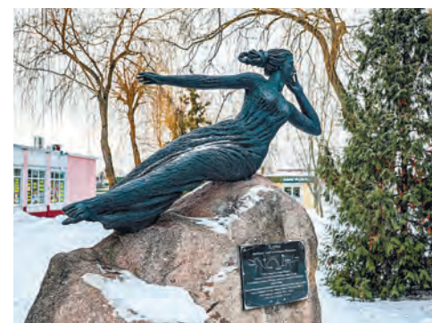
Наталья КОВАЛЕВА

Это предание долго не давало покоя местным краеведам, и лет 20 назад камень все-таки нашли, провели экспертизу, почистили, установили на нем табличку.