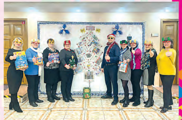
ППО СП ОАО «Спартак»

Каждый победитель рекламного мероприятия «Новогодний калейдоскоп»