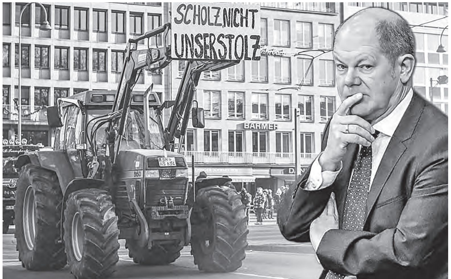
Фамилия Шольц созвучна в немецком языке со словом «гордость». Один из протестующих фермеров указал, что это совсем не одно и то же.