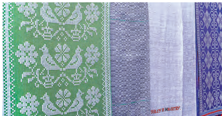
Вытканые подлесскими мастерами работы сегодня участвуют во многих фольклорных мероприятиях по всей стране.