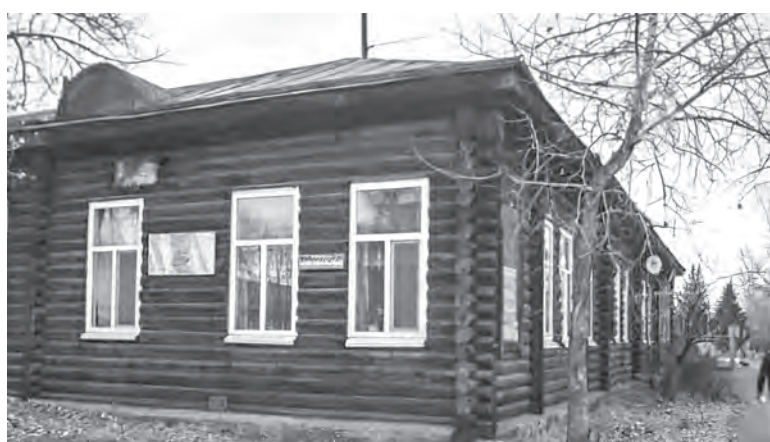
Дом в Кызыле, где вместе с другими основоположниками тувинской литературы жил и работал Пальмбаха.

Виктория ДАШКЕВИЧ