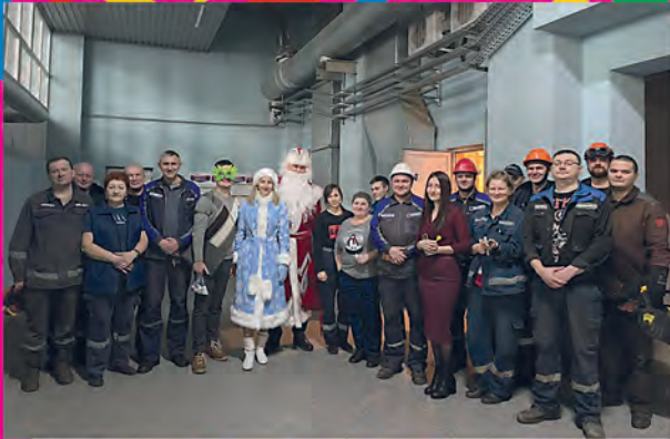
ПОО филиала «Барановичские тепловые сети» РУП «Брестэнерго»