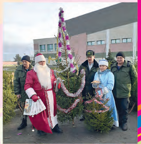
ПОО ГЛУ «Лунинецкий лесхоз»

Каждый победитель рекламного мероприятия «Новогодний калейдоскоп»