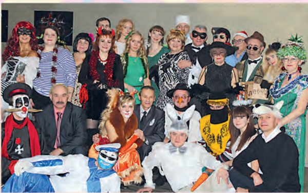
РУП «Полоцкий центр стандартизации, метрологии и сертификации»