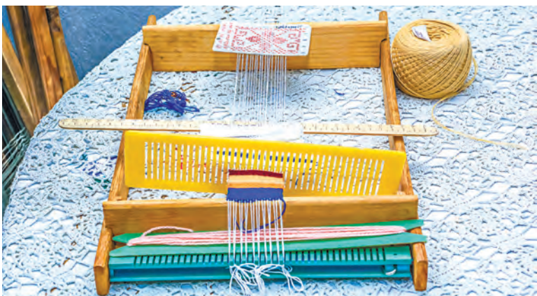
На этом миниатюрном станочке дети постигают азы мастерства.

Кружковцы начинают с простейшего – закладочек и салфеток. По мере освоения навыков юным подмастерьям можно будет братья и за взрослую работу – ткать на большом старинном станке рушники, узорчатые скатерти, покрывала-«посцілкі» и даже праздничные народные костюмы.