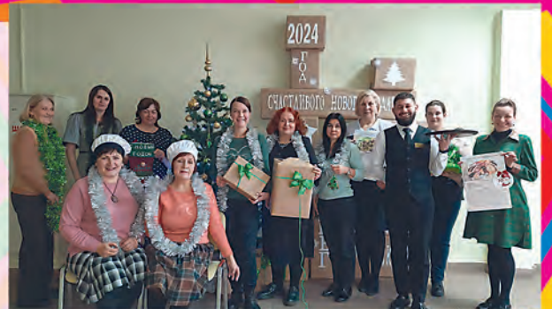
ПОО УО «Минский государственный колледж кулинарии»