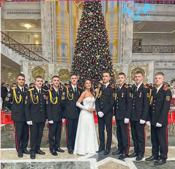
ПОО УО «Минское суворовское военное училище»