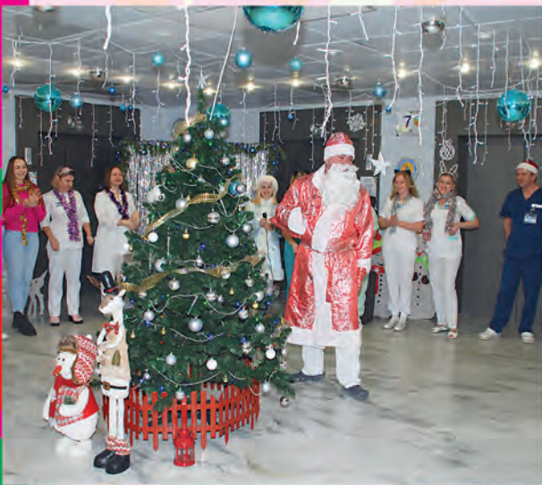
ПОО ГУ «Республиканский научно-практический центр радиационной медицины и экологии человека»