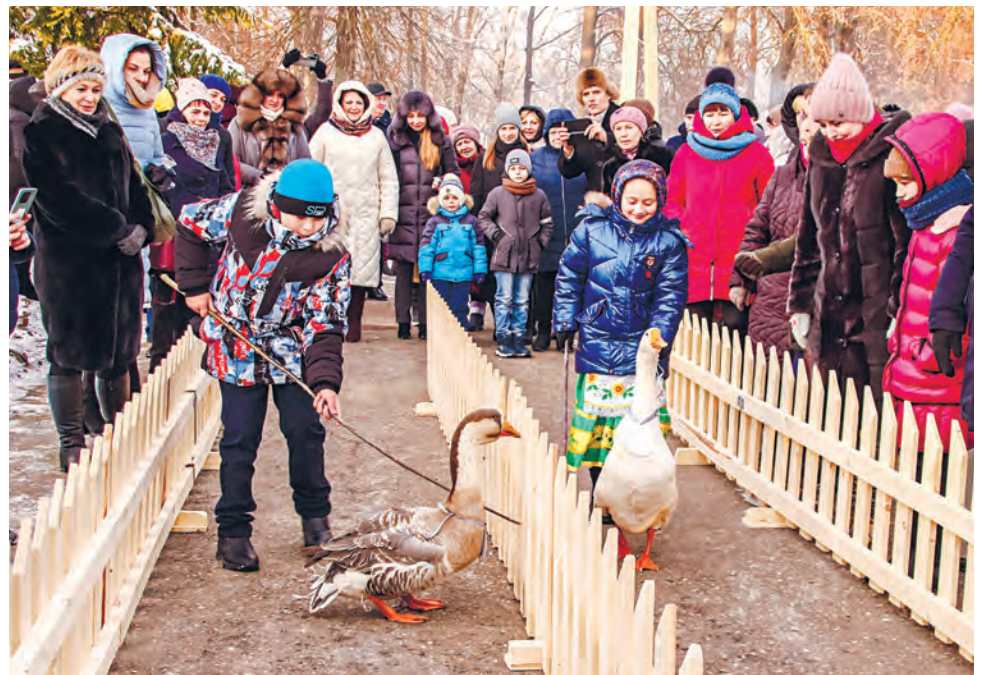
Белодубровские гусиные бега собирают болельщиков даже из соседних деревень.

Сельчанки и сейчас смеются, вспоминая, как в детстве с сестрами и братьями боролись за право поедания гусиного пупка. Казалось, на свете нет вкуснее деликатеса! Или как набиралось со всех подворий несколько сотен гусей и, чтобы отличить своих от соседских, выстригали им треугольником перья на ножках или краской помечали крылья.