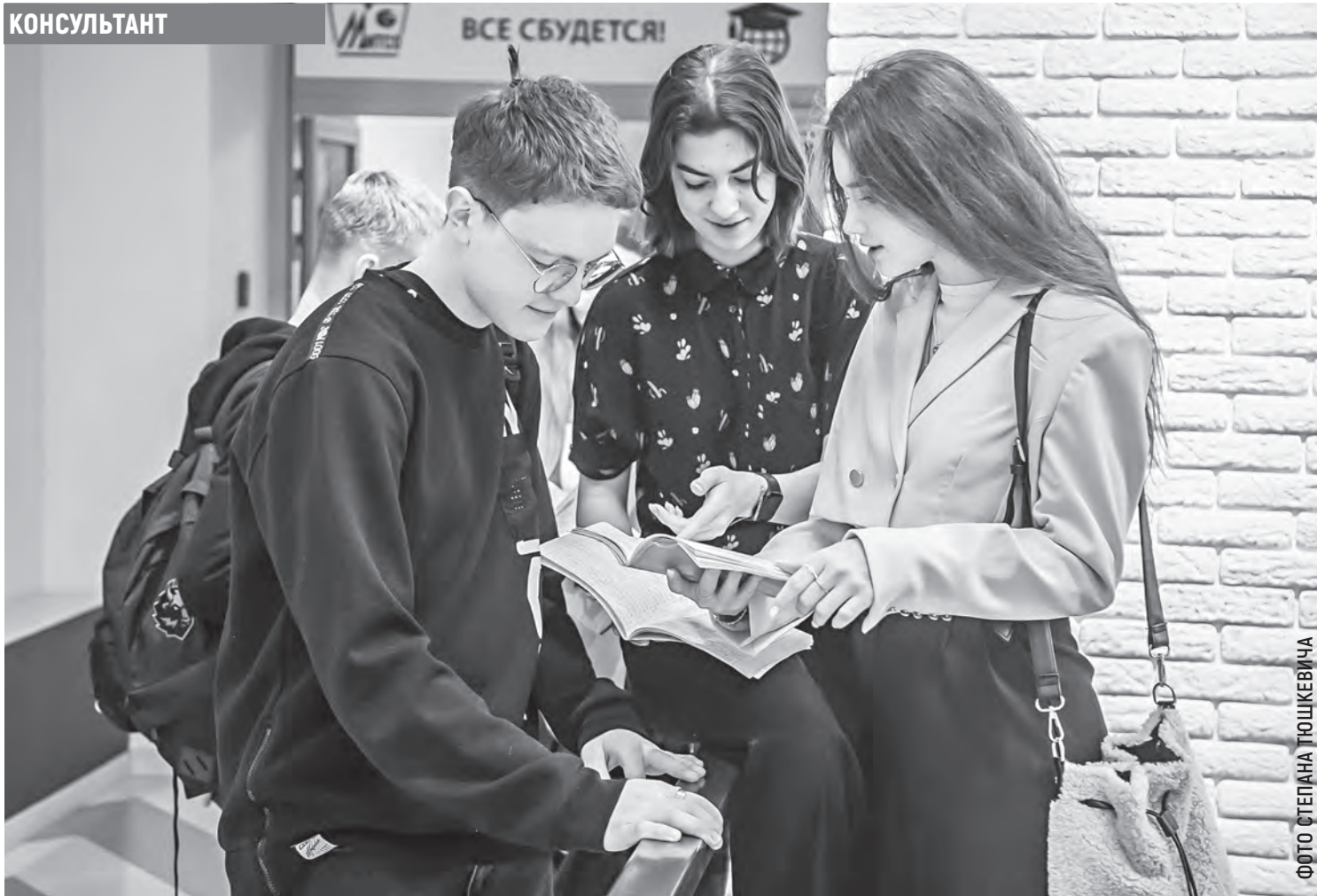
ФОТО СТЕПАНА ТЮШКЕВИЧА

По законодательству процесс распределения должен быть завершён не позже чем за два месяца до выпуска молодых специалистов, а это значит, что для тех, кто заканчивает учёбу летом, вопрос трудоустройства должен решиться до конца апреля.