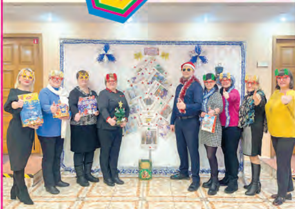
ППО СП ОАО «Спартак»