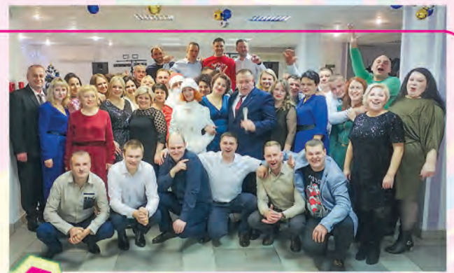
3 ППО филиала «Автобусный парк № 1» ОАО «Миноблавтотранс», Солигорск

Каждый победитель рекламного мероприятия «Новогодний калейдоскоп»