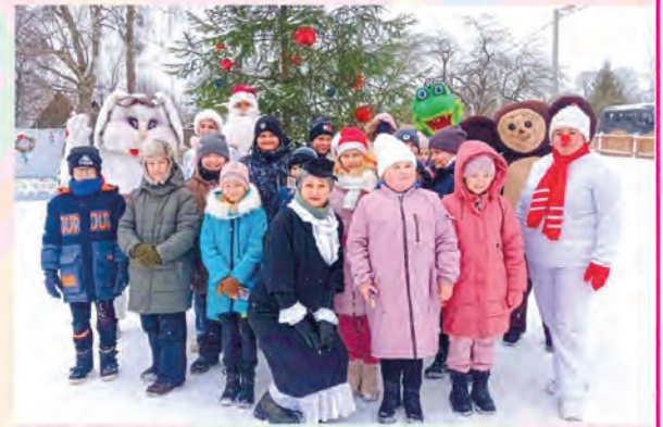
Слонимская РО Белорусского профсоюза работников культуры, информации, спорта и туризма (Слонимский районный центр культуры, народного творчества и ремесел)