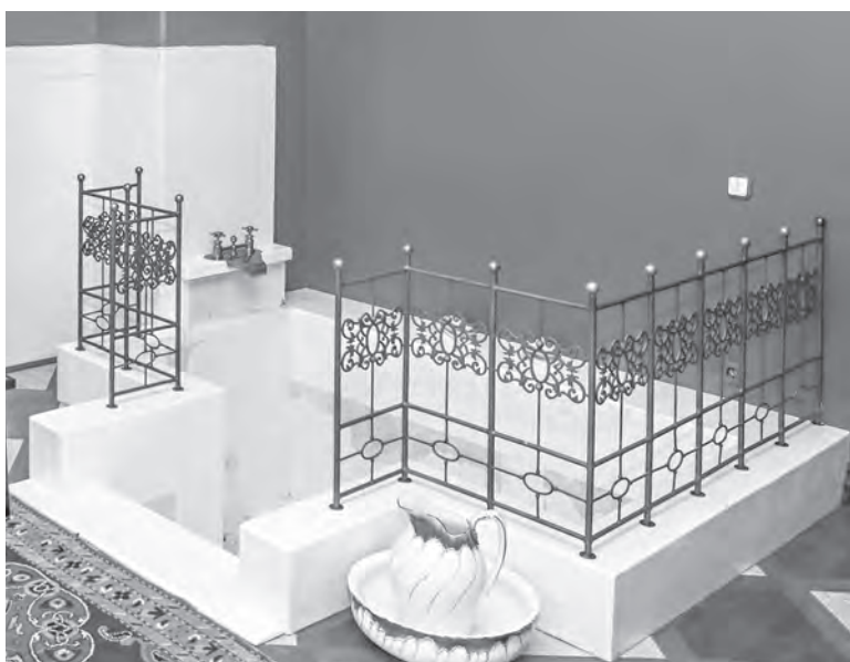
Бассейн с подогревом воды, представляющий собой древнеримские термы.