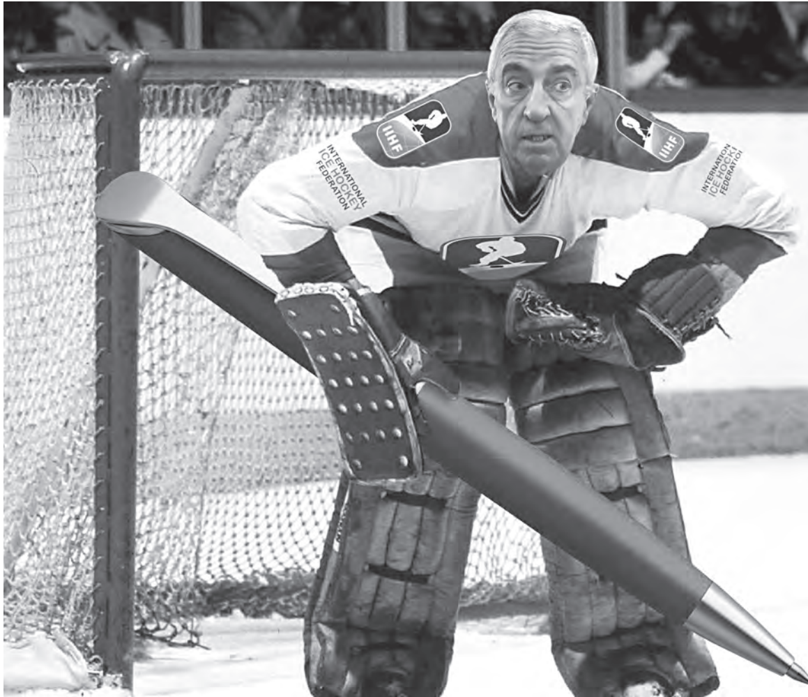
Пропустит ли глава Международной федерации хоккея Люк Тардиф белорусскую сборную на квалификацию к зимним Олимпийским играм?

В ближайшие дни станет ясно, допустят ли белорусских хоккеистов к отбору на Олимпиаду. Если честно, надежды мало. Спортивные чиновники, как и политические приверженцы санкций, в своих решениях руководствуются не логикой и здравым смыслом, а идеологическими стереотипами и закулисными подсказками.