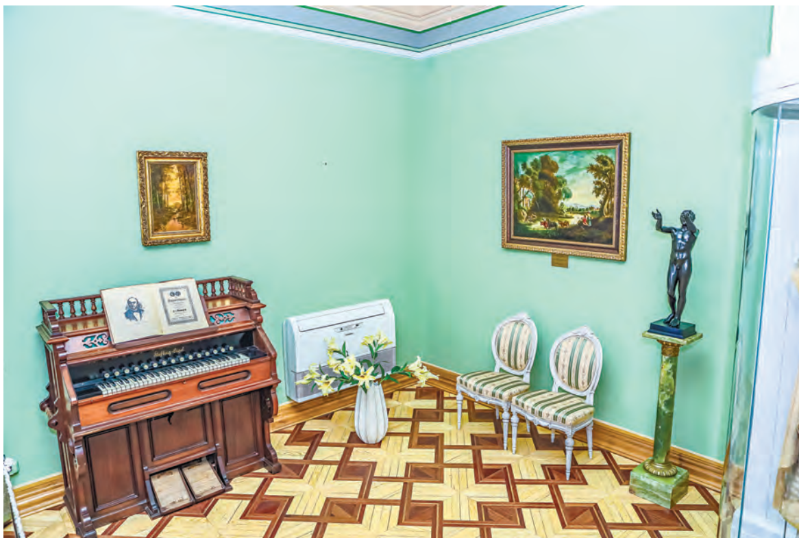
Реставраторам удалось воссоздать интерьеры старинной усадьбы.

Каждому хотелось удивить гостей и прослыть хлебосольным хозяином.