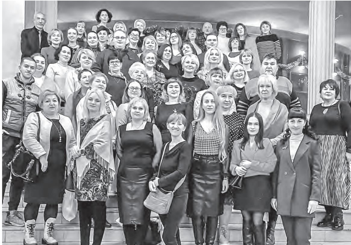
Первичка Витебской областной МРЭК объединяет всех сотрудников учреждения.

– Создали комиссию. Каждого человека приглашали индивидуально, поясняли, какие грядут изменения