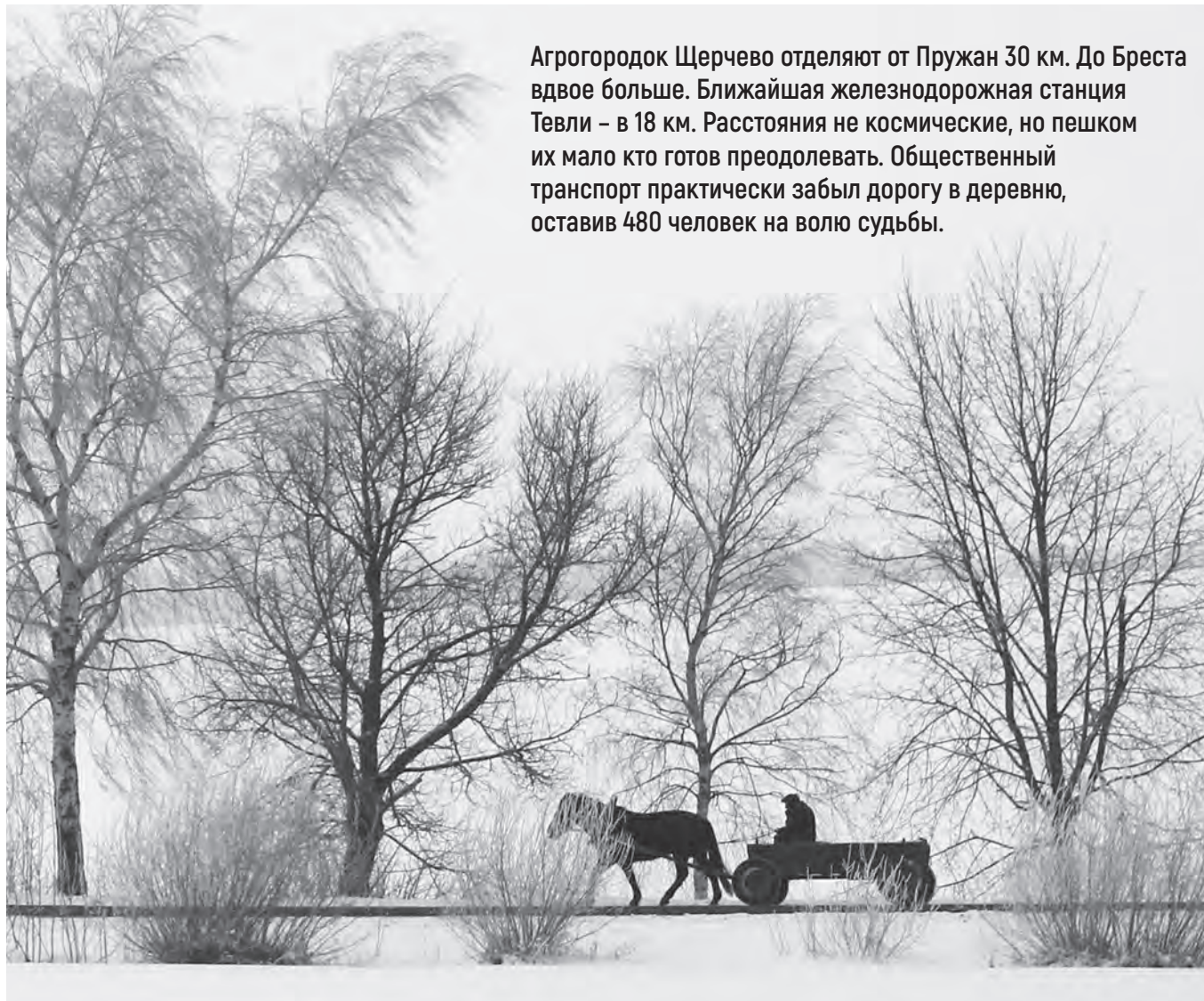
Фото носит иллюстративный характер.