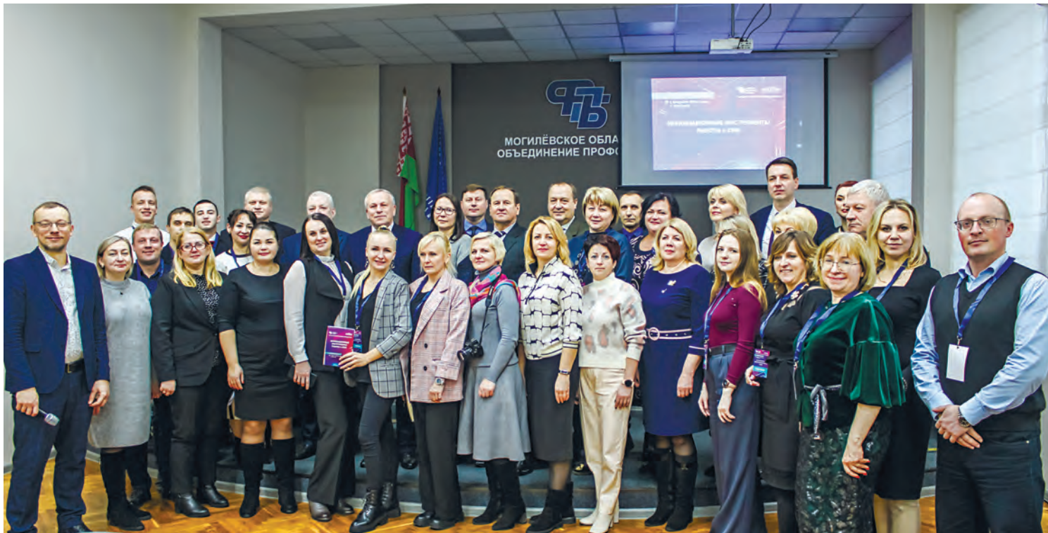
Медиафорум, который ежегодно проводится в Минске, дошел до областных центров. Настал черед и Могилева.

Медиафорум «Инновационные инструменты работы в СМИ» собрал журналистов и профактив Могилевщины