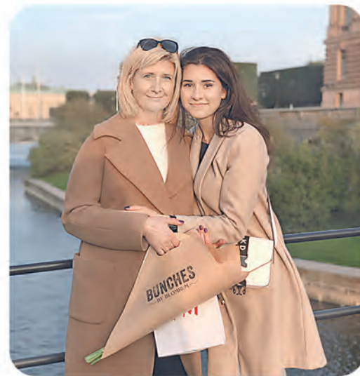
Автор фото: Татьяна Борейко, Полоцк