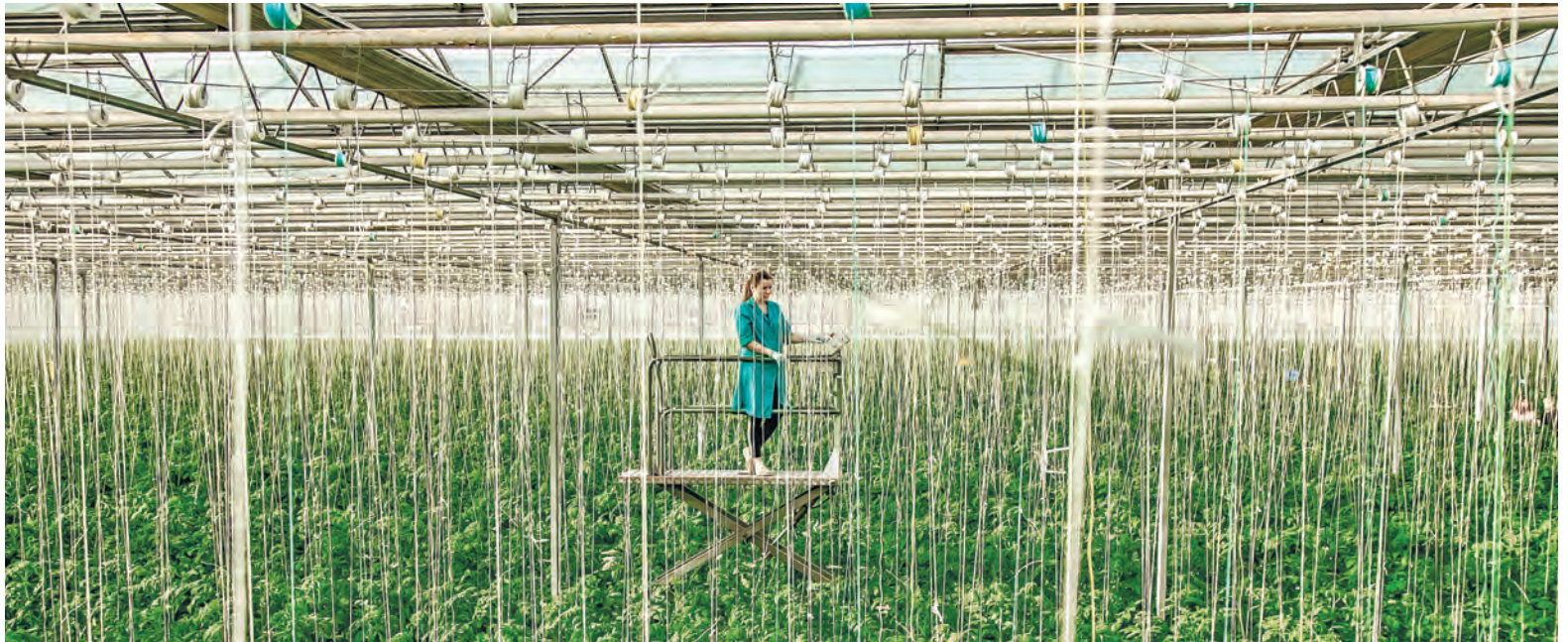
Использование электротележек облегчает труд овощеводов в теплицах. Техника управляется одной педалью, поднимается и опускается на нужный уровень.

Разным овощным культурам нужны разные условия, и всем одинаково – тепло. Как и людям, уверены руководство и профком Минской овощной фабрики.