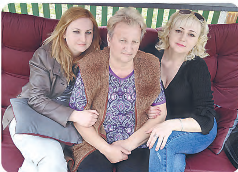
Автор фото: Ирина Крылович, Пинск