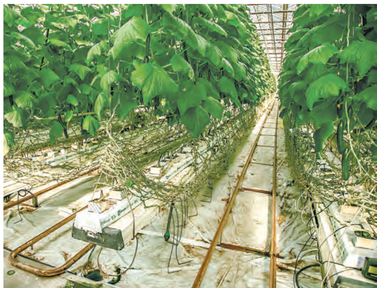
Огурцы и томаты в теплицах выращивают методом малообъемной гидропоники. Субстратом служит минеральная вата.