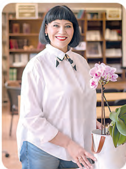
Автор фото: Татьяна Щерба, Барановичи