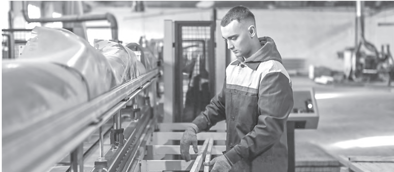
Молодым специалистам в ОАО «ФандОК» компенсируют расходы по найму жилья на протяжении всего срока отработки.

В профсоюзах проходит отчетно-выборная кампания. В первичках подводят «местные» итоги и избирают своих лидеров.