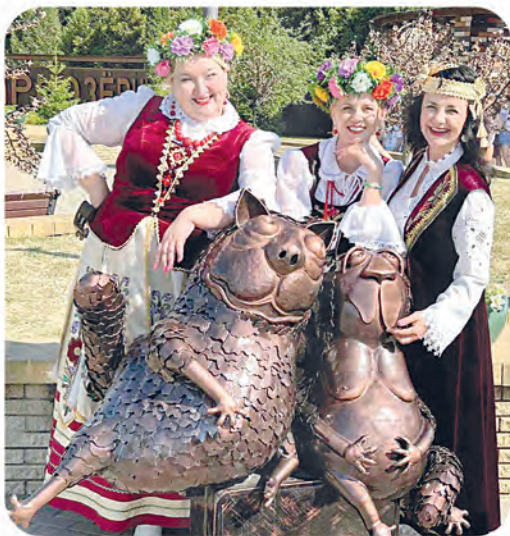
Автор фото: Ирина Савкина, Борисов