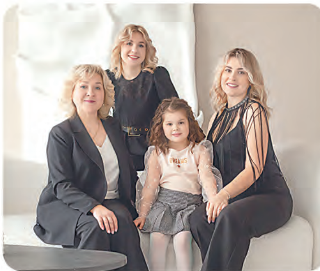
Автор фото: Светлана Хурс, Минск