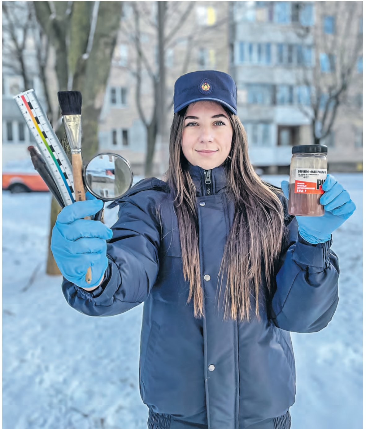
На осмотр места происшествия эксперты берут с собой криминалистический чемодан. В нем самые необходимые технические средства для обнаружения, фиксации и изъятия следов и вещественных доказательств. Его вес, как правило, составляет 15–20 кг.

в сохранности. Поверх кладем сеточку и деревянные палочки, схожие с теми, что используют производители мороженого. Криминалисты уточняют: подойдут и обычные веточки, проволока или любые материалы, которые помогут создать ребра жесткости. Это делается для того, чтобы слепок не разрушился при его транспортировке в лабораторию.