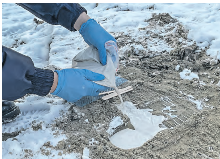
В 2023 году экспертами области проведено свыше 32 тысяч экспертиз. Самые популярные из них – дактилоскопические и трасологические.

Делаем небольшую канавку к следу – туда и будем лить гипсовую смесь. Так все мельчайшие детали, оставленные преступником, останутся