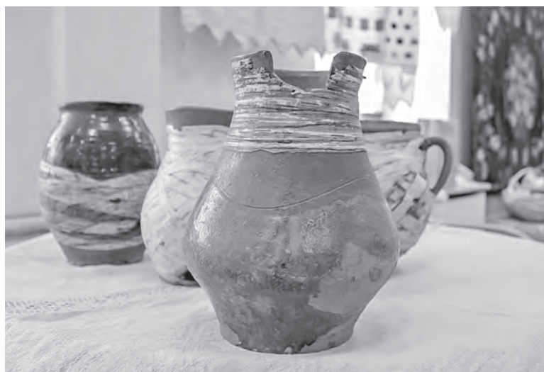
Традиция оплести керамику берестой зародилась еще в неолите.

регионах, где изготавливали мало качественной посуды. В западных районах Поозерья было только несколько относительно небольших гончарных центров городского типа с развитым производством. В деревнях