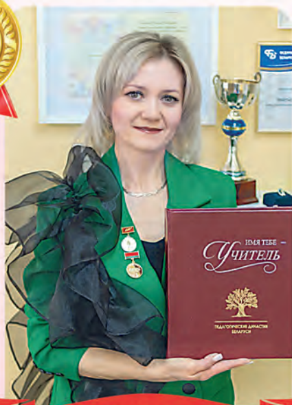
Автор фото: Наталья Чирцо, Минск