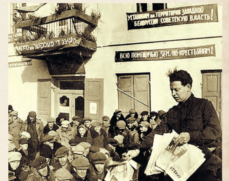
Митинг, посвященный воссоединению Западной Белоруссии с СССР, в Сморгони, 1939 г.

Летом 1929-го из 240 тысяч человек, состоявших в профорганизациях БССР, примерно треть работали на селе. По мере роста числа колхозов значение приобретала помощь города деревне. В декабре того же года Президиум ЦСПСБ рекомендовал каждому профсоюзу выделить лучших труженников предприятий и направить их в колхозы.