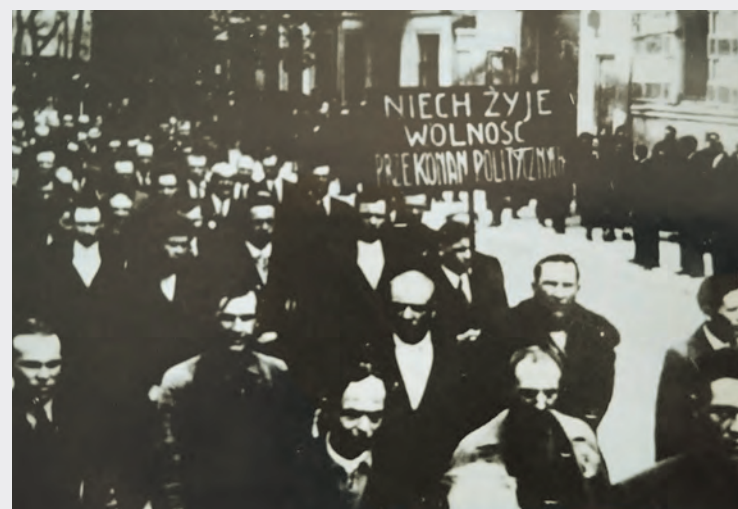
Первомайская демонстрация трудящихся, организованная профсоюзами в Гродно. 1937 год.

В мае 1926 года в Польше произошел государственный переворот под руководством Юзефа Пилсудского, который фактически установил диктатуру. Это послужило началом радикальных реформ, а также агрессивной политики колонизации белорусского населения.