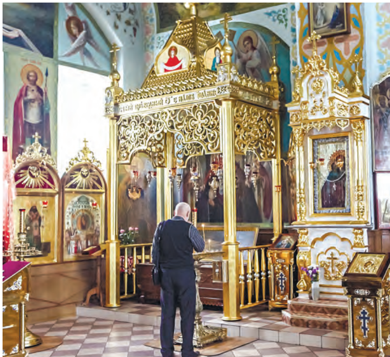
Ежегодно тысячи паломников из разных стран мира приезжают в Корму в поисках чуда. Здесь хранятся нетленные мощи белорусского святого Иоанна Кормянского, которого еще называют заступником гомельской земли.

Иоанн любил повторять слова апостола Иакова: «Вера без дел мертва». Поэтому при жизни он помогал вдовам и сиротам. И не оставил паству после смерти.