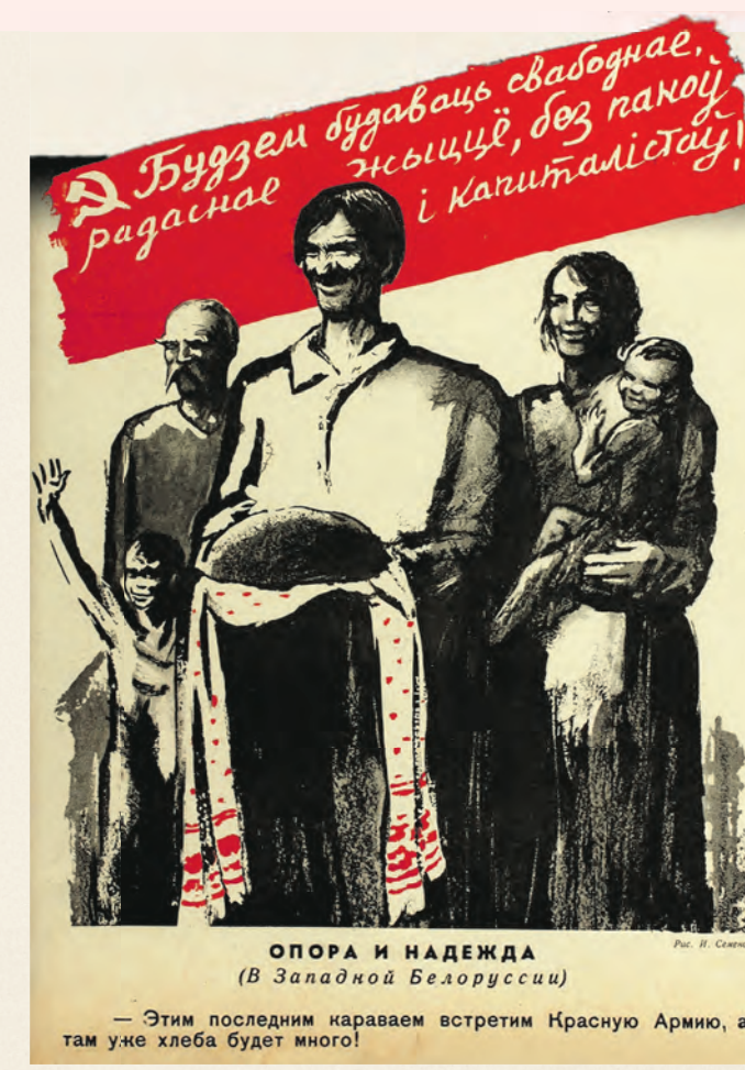
ОПОРА И НАДЕЖДА (В Западной Белоруссии) — Этим последним караваном встретим Красную Армию, а там уже хлеба будет много!

Параллельно с этим профсоюзы занимались улучшением системы оплаты труда, нормированием рабочего дня, контролем за безопасностью производства, заключением коллективных договоров.