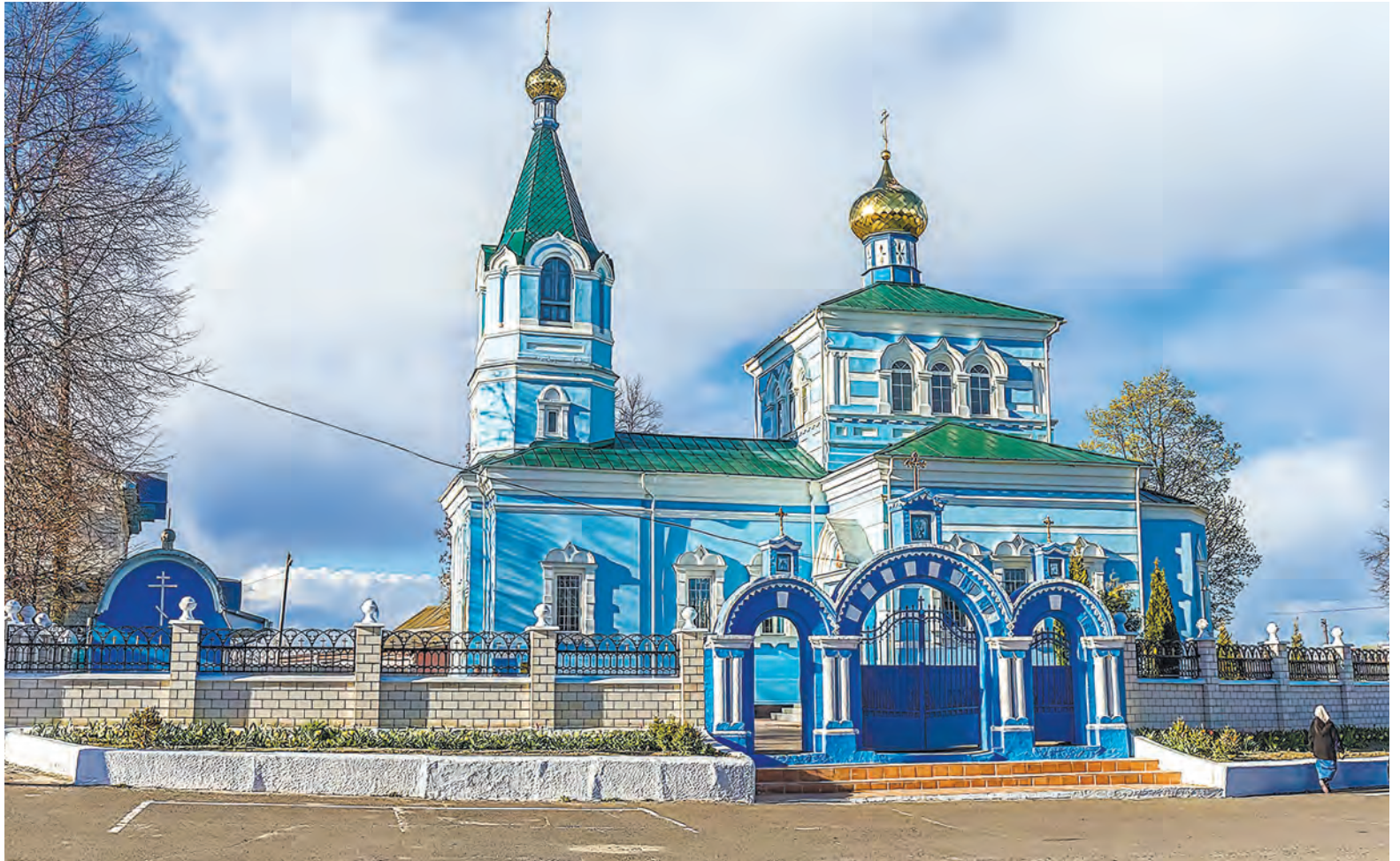
Кормянский монастырь один из самых молодых в Беларуси. Обитель учреждена определением Святого Синода Белорусской православной церкви 8 августа 2000 года. Однако его историческая летопись началась гораздо раньше – в 1760 году.