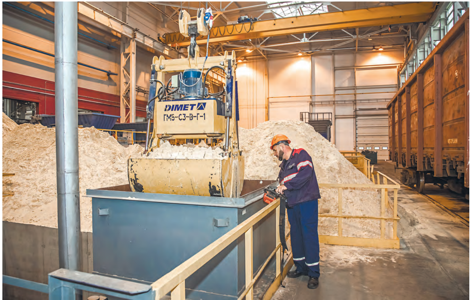
Каждый – от простого работника до руководителя – должен быть заинтересован в том, чтобы соблюдались правила безопасности.

Еще один прорывной момент – предоставление налоговых льгот для молодых специалистов, которые пришли на первое рабочее место по распределению. Профсоюзам удалось добиться введения для них стандартного налогового вычета при уплате подоходного налога. Сегодня он установлен в размере 620 рублей в месяц.