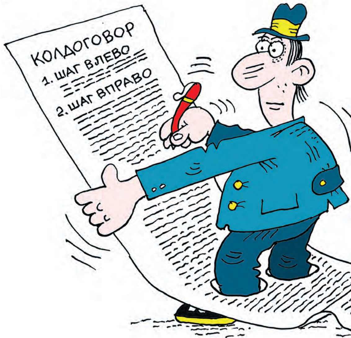
РИСУНОК ОЛЕГА ПОПОВА