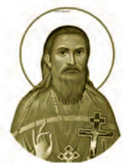
Священномученик Николай Околович 1863–1934 Место рождения: д. Узлятино, Витебский уезд День памяти: 12 сентября