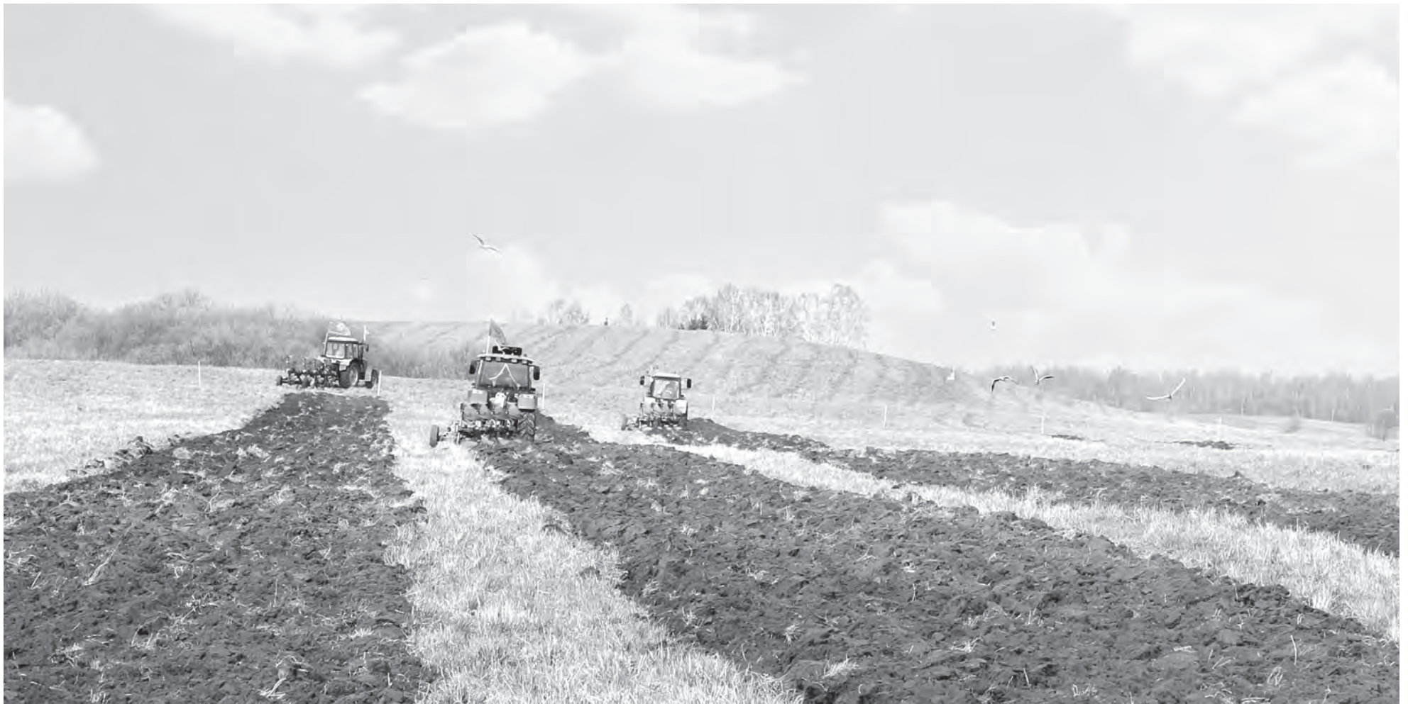
На полях Шумилинского района Витебской области началась посевная.