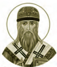
Святитель Мина, епископ Полоцкий ок.1050–1116 Место рождения: г. Полоцк (Р) День памяти: 3 июля