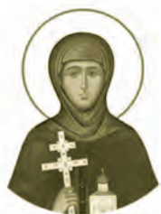
Преподобная Евфросиния, нгумня Полотцкая ок.1104–1173 Место рождения: г. Полоцк День памяти: 5 июня