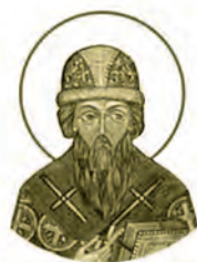
Святитель Симеон, епископ Полоцкий ок.1230–1289 Место рождения: г. Полоцк День памяти: 16 февраля