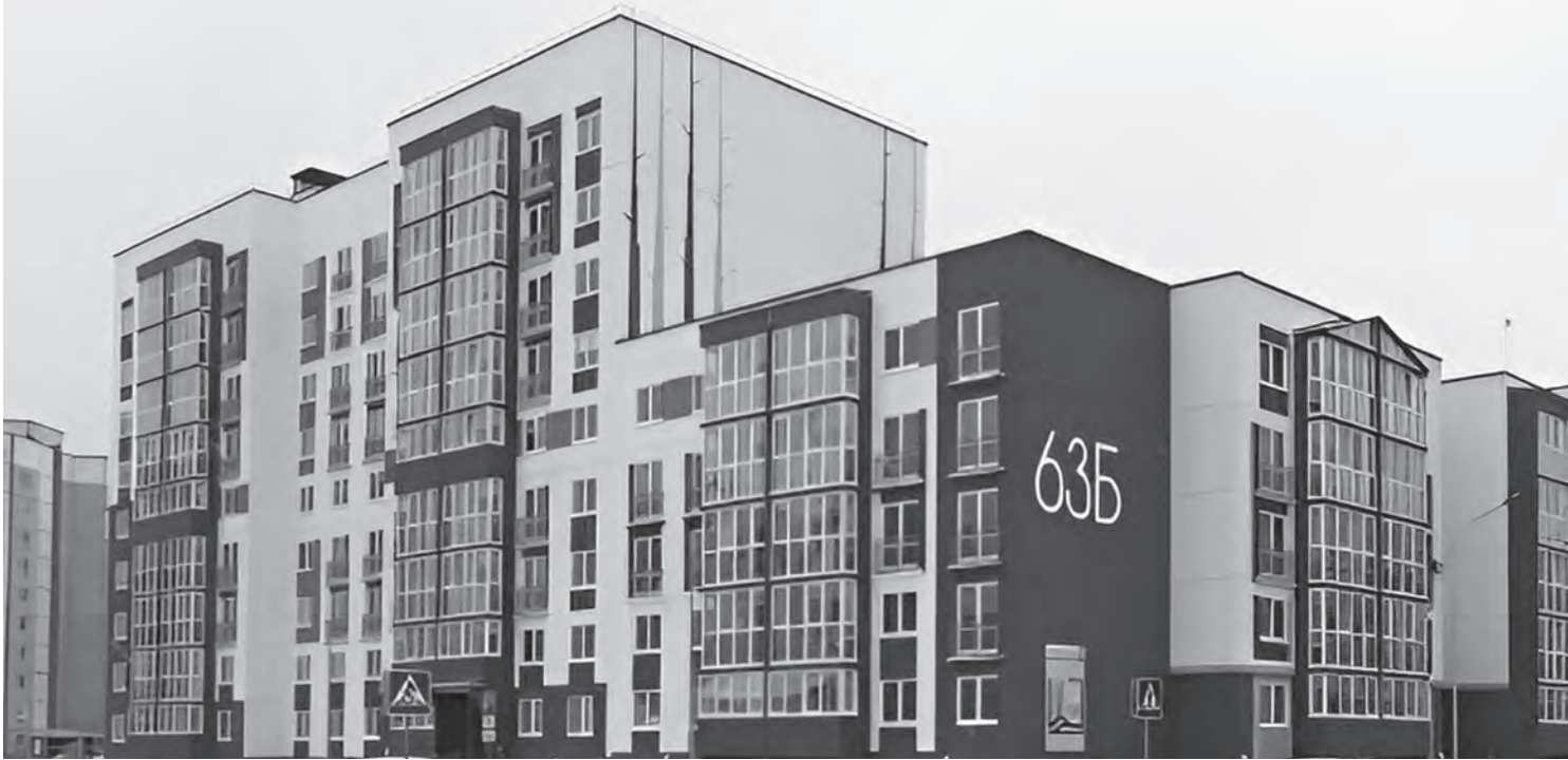
Дома, возводимые «Брестжилстроем», отличаются комфортом и доступной ценой.