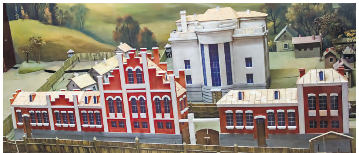
В музее воссозданы помещения, в которых ютились евреи. Красные постройки – мастерские, слева от большого белого здания – бараки.