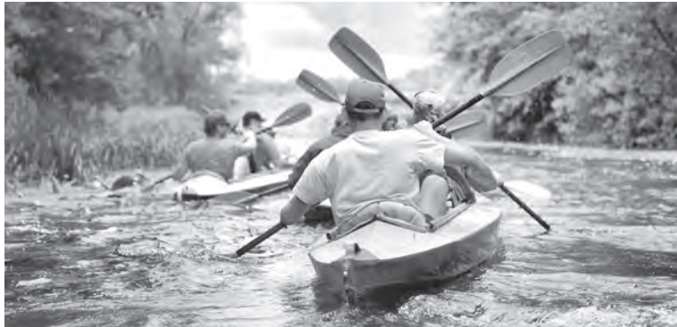
Фото носит иллюстративный характер.

– Помимо ветеранской сборной по мини-футболу, у нас есть и молодежная. Ребята участвуют и в соревнованиях отраслевого профсоюза. Создали свои команды также поклонники во-