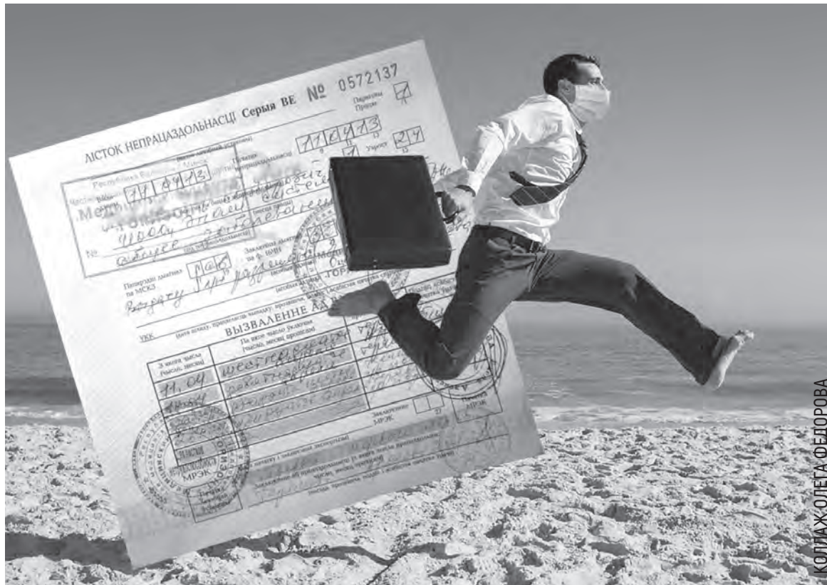
КОллаж: ОЛЕГА ФЕДОРОВА