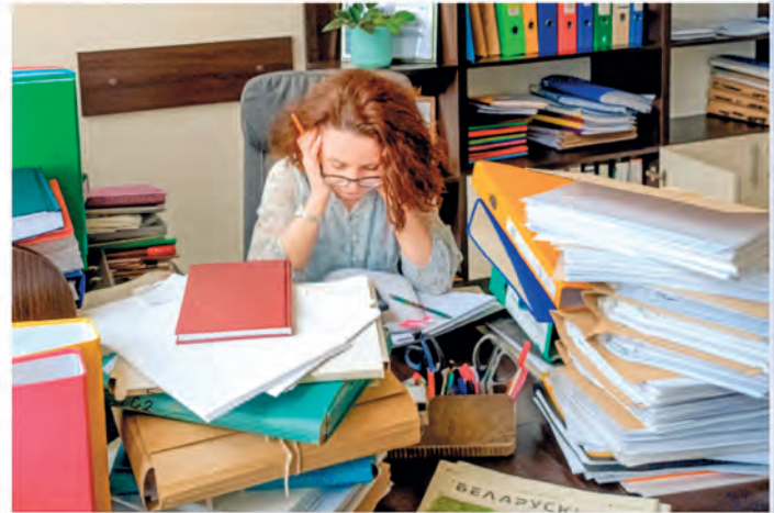
ППО государственного научного учреждения «Институт порошковой металлургии имени академика О.В. Романа», Минск