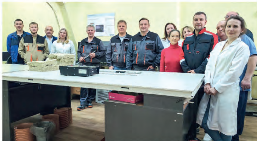
ППО РУП «Стройтехнорм», Минск