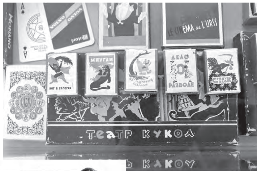
Коллекция спичечных коробков появилась в краеведческом музее благодаря местным филуменистам.

А еще здесь немало археологических находок. Наследники археолога Леонида Алексеева, который в 1950-е проводил раскопки на Браславщине и первым исследовал городище Масковичи, передали в музей предметы каменного века, бусины периода раннего Средневековья. Впечатляют находки, сделанные патриархом археологии Леонидом Колединским. Его исследовательская деятельность тесно связана с Верхним замком Витебска.