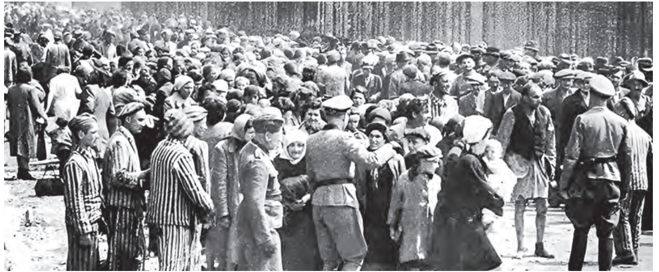
По некоторым данным, в концлагерях на территории Беларуси в 1941–1944 годах погибли свыше 1,5 миллиона человек.

Им промыли мозги геббельсовской пропагандой и нацистской теорией расо-