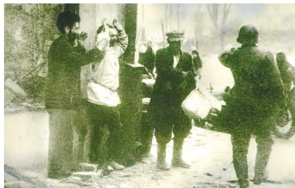
Арест евреев, 1941 год.