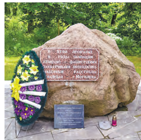
В Казимировке, в районах Пашково и Новопашково фашисты уничтожили свыше 10 тысяч мирных граждан.

знаком в Казимировском лесу появились четыре братские могилы.