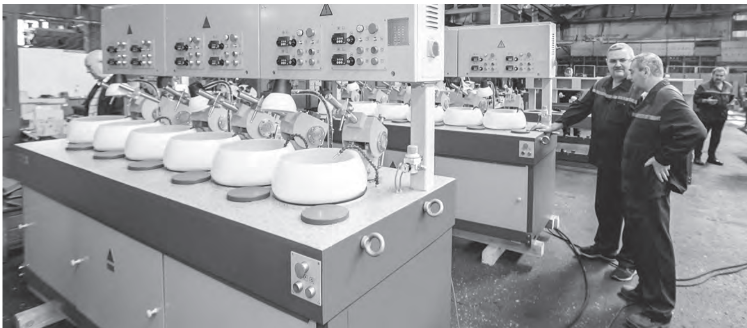
ОАО «Сморгонский завод оптического станкостроения» 40% своей продукции поставяет на экспорт.