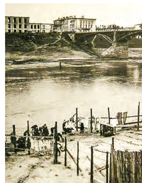
Ограждение гетто со стороны Двины.

Первое время режим был не самым жестким. Немцы не кормили евреев, и они контактировали с местными жителями, обменивая вещи на продукты. Ночью выбирались за ограждения, чтобы разжиться едой. Но в середине сентября в газете появилось объявление, угрожавшее уголовной ответственностью за нахождение евреев вне территории гетто и присутствие мирных жителей другой национальности на его территории. Узники умирали