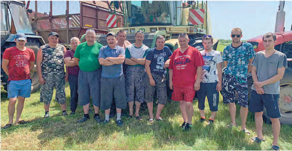
Верхнедвинская районная профсоюзная организация Белорусского профсоюза работников АПК (ППО ОАО «Прудинки»)