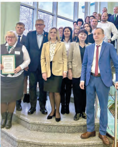
ОПО ОАО «АСБ Беларусбанк», Кобрин