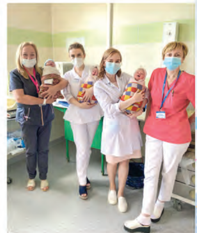
ППО УЗ «Клинический родильный дом Минской области»

Подробности рекламного мероприятия на belchas.1prof.by