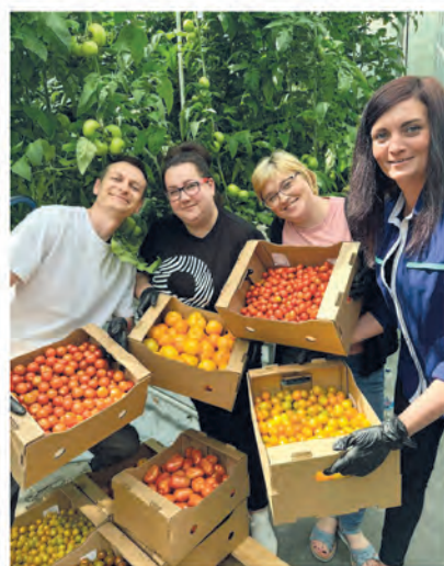
ППО ОАО «Тепличный комбинат Мачулищи».