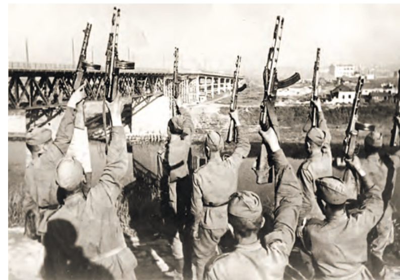
Салют в честь освобождения Витебска.

Такой статус согласно приказу Гитлера от 8 марта 1944 года получили 11 городов. Витебск и Бобруйск, находившиеся на флангах группы армий «Центр», укрепили особенно сильно. Все города-крепости являлись также стратегически важными транспортными узлами. Так, Витебск