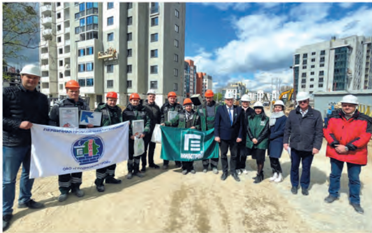
ППО ОАО «Гродножилстрой».