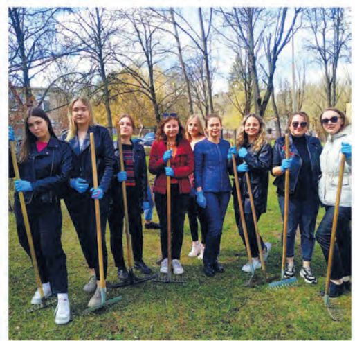
ППО инспекции Министерства по налогам и сборам Республики Беларусь по Первомайскому району г. Минска.

Подробности рекламного мероприятия на belchas.1prof.by