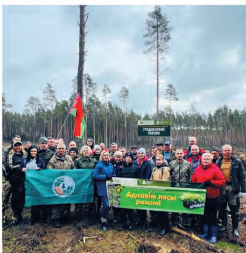
ППО Государственного лесохозяйственного учреждения «Гродненский лесхоз».