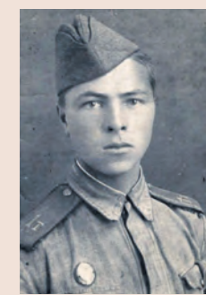
Иван Мельнов, лейтенант 364-й стрелковой дивизии, герой Советского Союза.

Двадцатилетнему парню не суждено было дожить до светлого праздника – Дня Победы: 19 июля 1944 года Мельнов пал смертью храбрых в бою. Похоронен в братской могиле в поселке Свислочь Гродненской области.