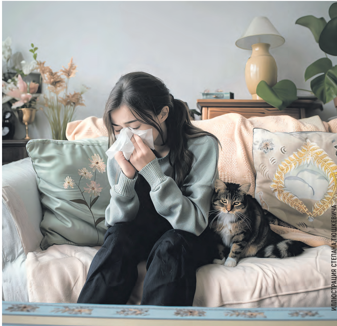
ИЛЛЮСТРАЦИЯ СТЕПАНА ТЮШКЕВИЧА

Большинство пациентов с этой аллергией сильнее страдают в теплую пору, когда споры активно распространяются.