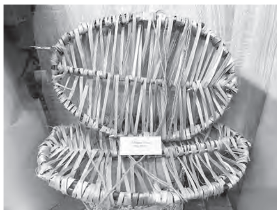
Мокроступы – этот атрибут сельчан помог солдатам 1-го Белорусского фронта 23 июня 1944 года пройти топкое болото.

– Однажды мы сидели с командующим 18-м корпусом генералом Ивановым в лесу у тлеющего костра среди гвардейцев, беседуя об этих гиблых болотах, – писал в мемуарах Батов.