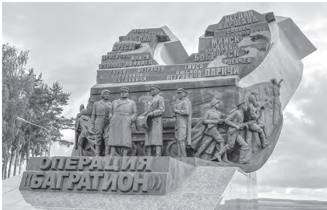
В честь героического подвига героев-освободителей 10 лет назад на рубеже старта грандиозной военной операции вблизи деревни Раковичи Светлогорского района возвели монумент «Багратион». Он напоминает о событиях 1944 года и о том, какой ценой досталась Великая Победа.

К вечеру следующего дня были сделаны 20 комплектов мокроступов. Дождавшись сумерек, разведчики с офицерами инженерного отдела начали преодоление одного из участков болота. Двигались осторожно, через определенные промежутки измеряли глубину топи. Отряд незамеченным вышел за передний край