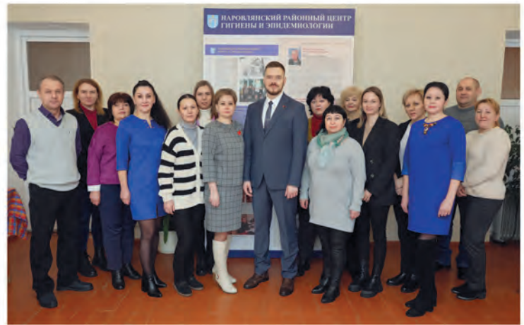
ППО ГУ «Наровлянский районный центр гигиены и эпидемиологии».