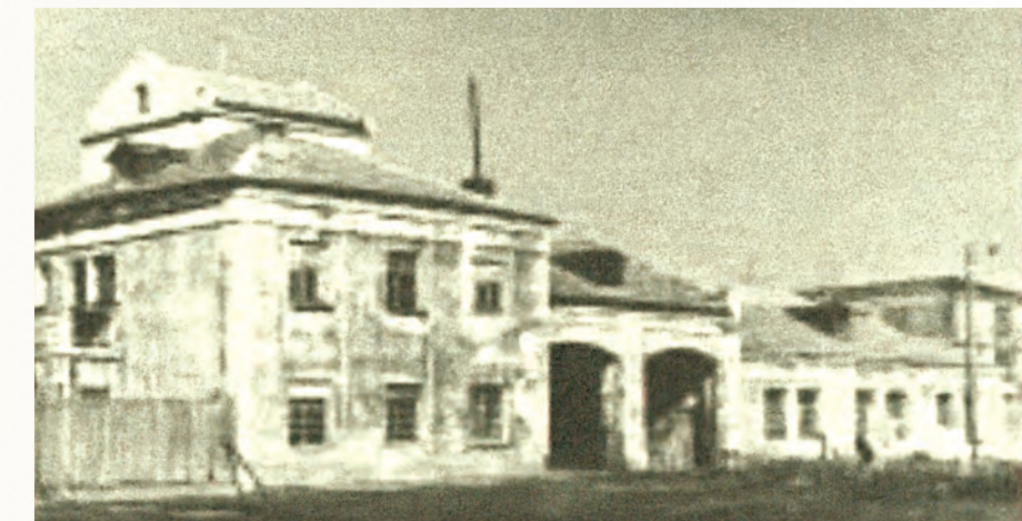
Предположительно здесь восстанавливалось производство обувной фабрики «Красный Октябрь».

Станислава МАРЦИНКЕВИЧ