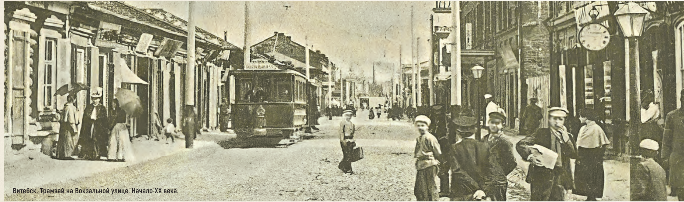
Витебск. Трамвай на Вокзальной улице. Начало XX века.