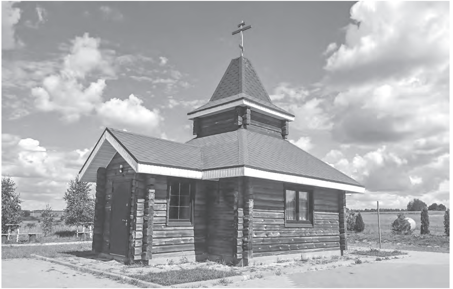
В деревне Дубинка Могилевского района родник освятили несколько лет назад.

Недалеко от деревни Кохоновка, в 25 километрах от Осиповичей, есть урочище Проща. В лесу стоит храм иконы Божьей Матери «Животворящий