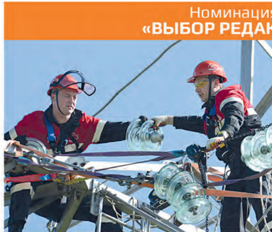
Номинация «ВЫБОР РЕДАКЦИИ»

★ ППО филиала «Гродненские электрические сети» РУП «Гродноэнерго».