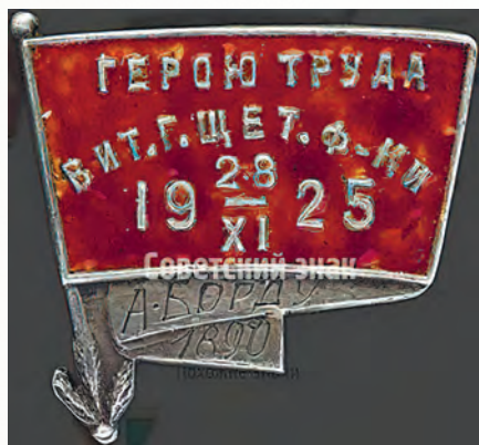
Знак Героя Труда Витебской городской щетинной фабрики.

Пуск комбината планировался в июле 1931 года. Но строительство затянулось, и предприятие заработало в октябре. В 1936 году открыли дом отдыха Витебского щетинно-щеточного комбината (сегодня это санаторий «Лётцы»).