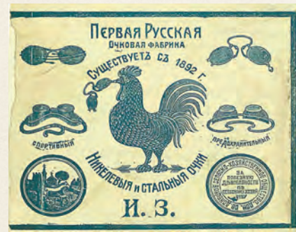
Реклама очков, 1920–1930-е годы.

чай сокращения штата, производственных травм, сохранял право в течение 14 месяцев вернуться избранным на профессиональную, политическую или советскую работу.