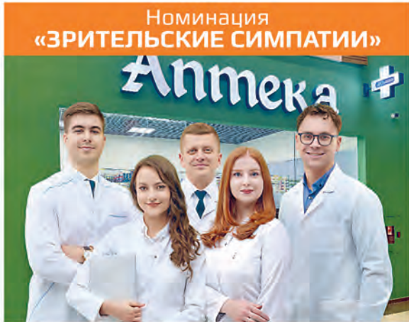
Номинация «ЗРИТЕЛЬСКИЕ СИМПАТИИ»