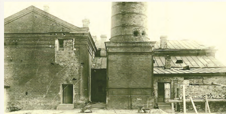
Зеркальная фабрика в годы оккупации.

Не были восстановлены после войны некоторые предприятия, которые доказали свою жизнеспособность в непростой для экономики период 1920–1930-х годов. Росту безработицы в 1921-м способствовали войны, гиперинфляция, остановка ряда предприятий и другие причины. Безработными становились в основном женщины и подростки. А преимущество участия на свободные места среди некачественно подготовленных работников получали демобилизованные красноармейцы.