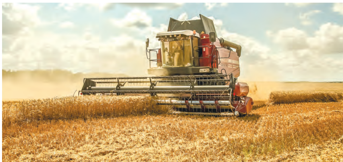
Средняя урожайность пшеницы в хозяйстве «Серволюкс Агро» составляет 50 ц/га.

– Мы приехали в том числе поздравить руку людям, которые сегодня достигли очень хороших, высоких результатов. Сказать им большое спасибо, – подчеркнул председатель ФПБ.