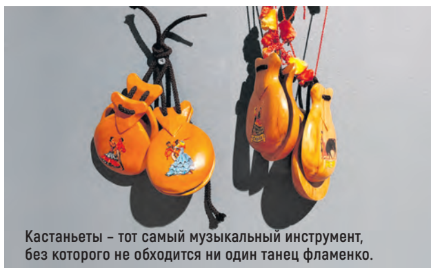
Кастаньеты – тот самый музыкальный инструмент, без которого не обходится ни один танец фламенко.