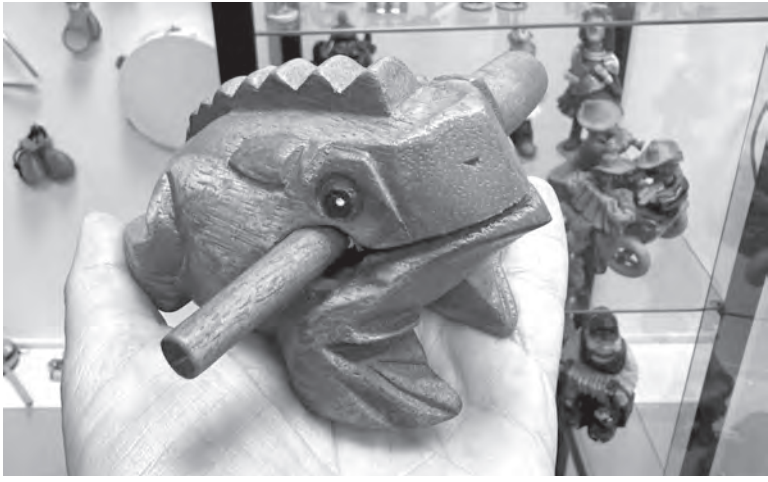
Считается, что, играя на такой музыкальной лягушке, можно привлечь счастье!

виртуальной реальности можно погрузиться в определенную эпоху или даже в картину. Другое дело, что далеко не всегда этот формат применим. Есть экспонаты, которые в силу хрупкости и уникальности приходится размещать только в классическом варианте – за стеклом.