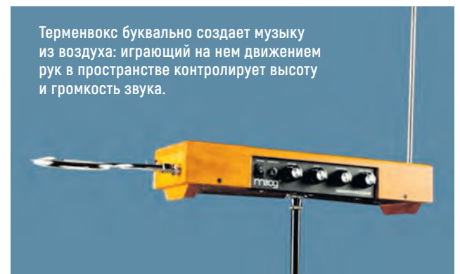
Терменвокс буквально создает музыку из воздуха: играющий на нем движением рук в пространстве контролирует высоту и громкость звука.