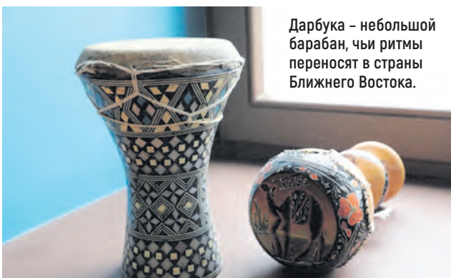
Дарбука – небольшой барабан, чьи ритмы переносят в страны Ближнего Востока.

Музыкальные инструменты нуждаются в обслуживании.