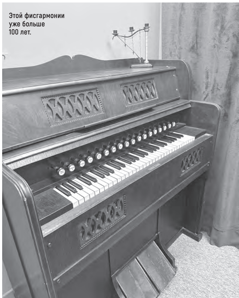
Этой фисгармонии уже больше 100 лет.

– Арфа, орган и... терменвокс. У последнего нет ни струн, ни клавиш, а управляется электромагнитным полем. То есть ты просто «шаманишь» руками – и он издает звуки. У большинства посетителей обычно получается вой привидений, но профессиональным музыкантам удается добиться имитации человеческого пения. Это завораживает. Послушайте обязательно!