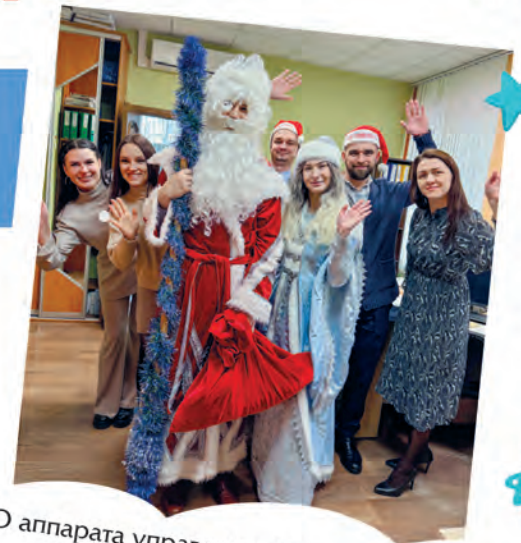
ППО аппарата управления УП «Гроднооблгаз»