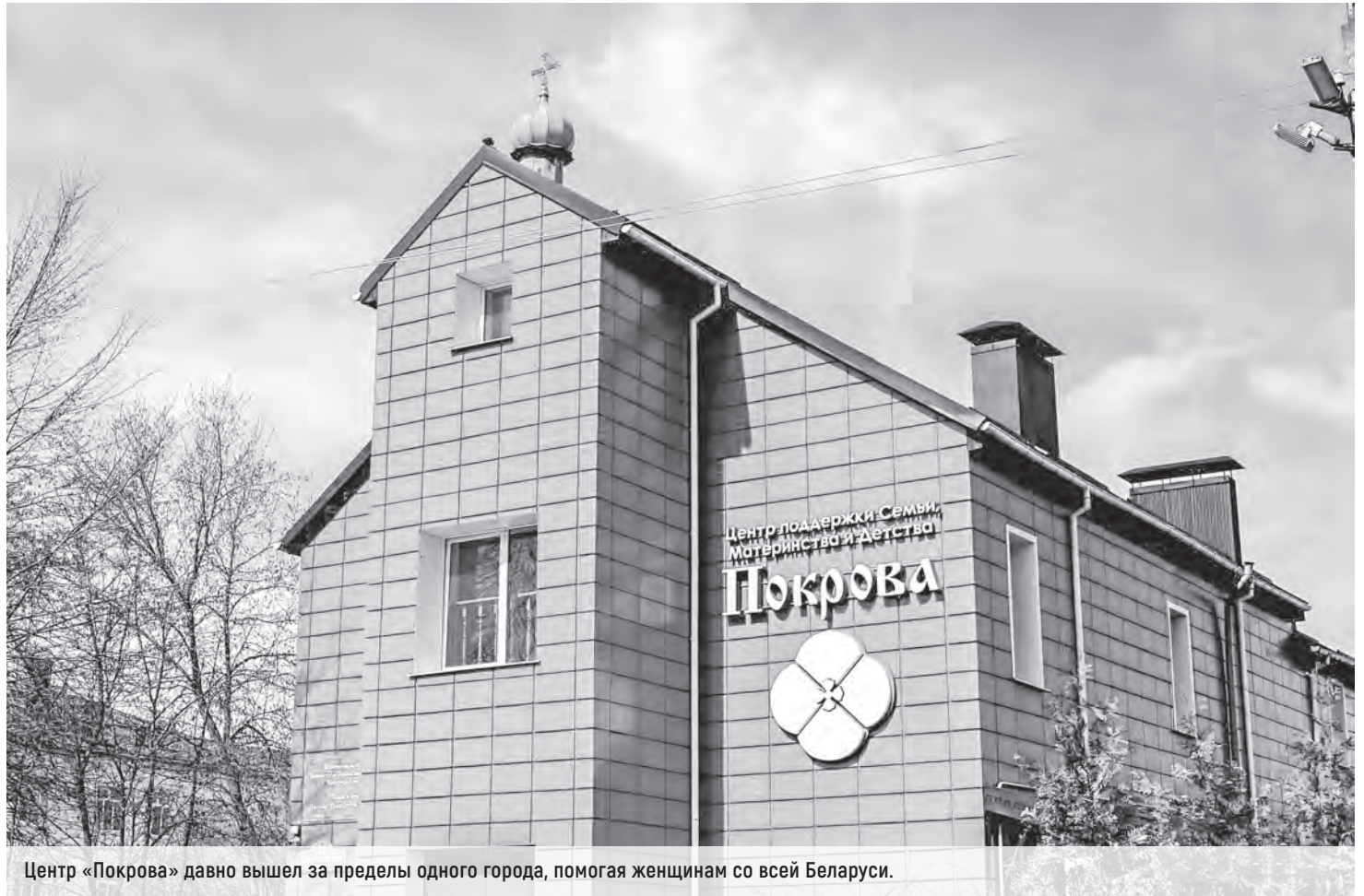
Центр «Покрова» давно вышел за пределы одного города, помогая женщинам со всей Беларуси.