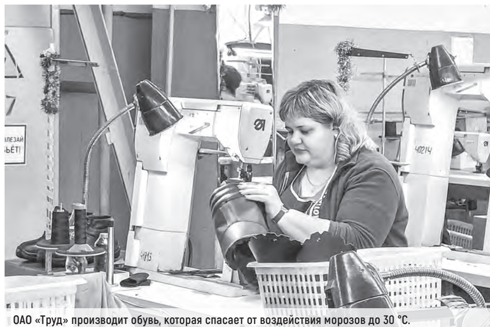
ОАО «Труд» производит обувь, которая спасает от воздействия морозов до 30 °С.

Виктория БОНДАРЧИК (Могилев), Ирина БЕСПАЛАЯ (Гомель) Фото авторов