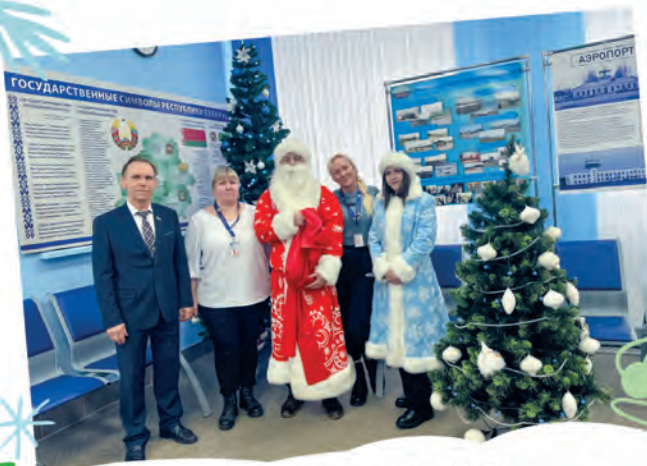
ППО Витебского филиала ГП «Белазронавигация»