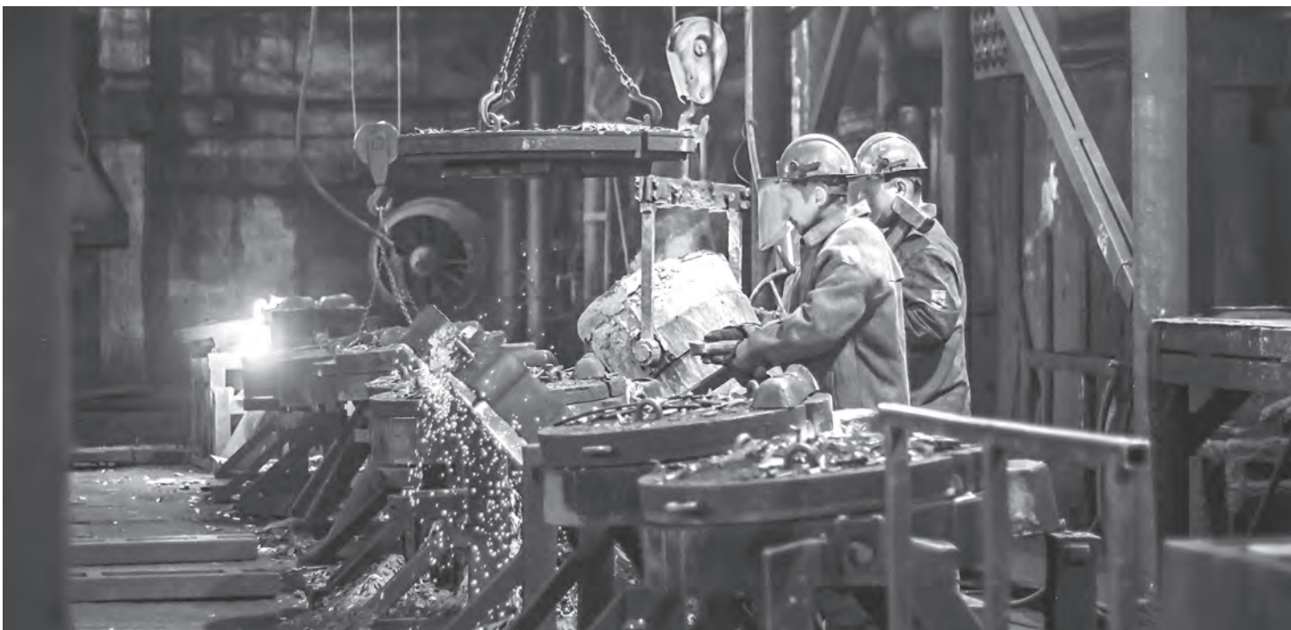
На Могилевском металлургическом заводе работают 20 общественных инспекторов по охране труда, которые ведут журналы ежедневного контроля.

Зима в разгаре, и морозы все крепчают. Как соблюдается температурный режим на рабочих местах? Профсоюзные инспекторы и журналисты нашей газеты побывали на Могилевском металлургическом заводе и Гомельской обувной фабрике «Труд».