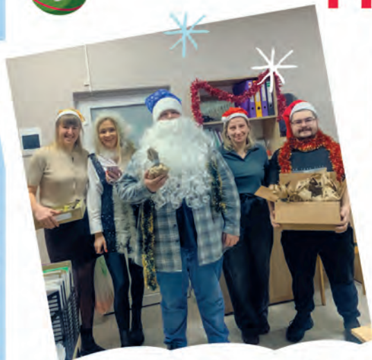
ППО РУП «Белгипролес»