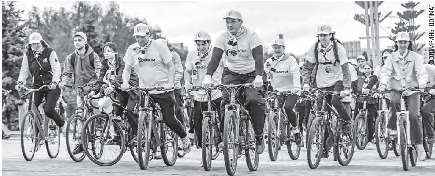
К велопробегу «Дорогами памяти» присоединяются тысячи профактивистов. Сегодня он проходит в формате марафона, в котором участвуют все регионы страны.

В основу будущего отраслевого профсоюза нашей страны легло два события. В июле 1919-го был образован Всероссийский союз работников просвещения и социалистической культуры, а спустя чуть более года в Минске создано Временное правление этой структуры, которое занялось подготовкой к созыву съезда. Он как раз и состоялся в те самые январские дни 105 лет назад, став впоследствии официальной датой рождения белорусского профдвижения педагогов. А новейшая история профсоюза работников образования и науки берет начало с 1990-го. Тогда прошел его I съезд, были приняты временный Устав и Программа деятельности, провозглашены самостоятельность, независимость профсоюза от органов власти, политических партий и движений.