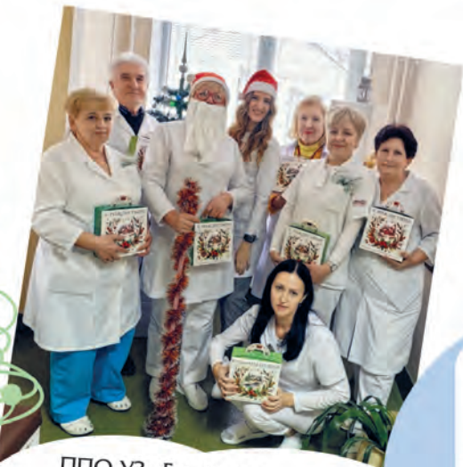
ППО УЗ «Брестская центральная поликлиника»