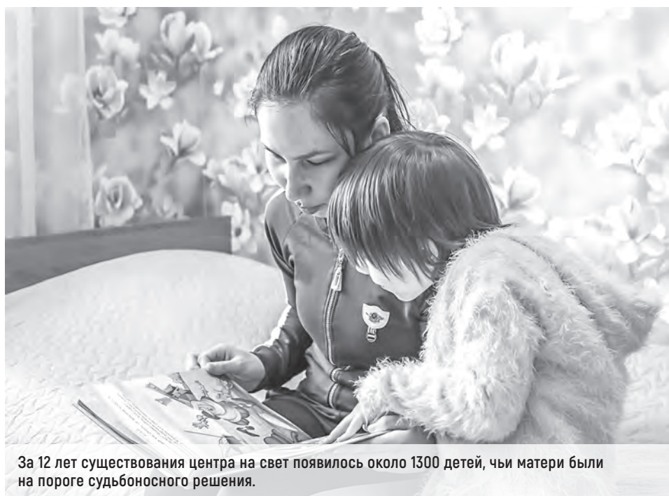
За 12 лет существования центра на свет появилось около 1300 детей, чьи матери были на пороге судьбоносного решения.