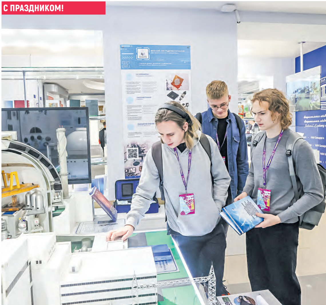
За минувшие 14 сезонов проекта «100 идей для Беларуси» реализовано более 3,5 тыс. инициатив, которые сегодня приносят пользу государству.