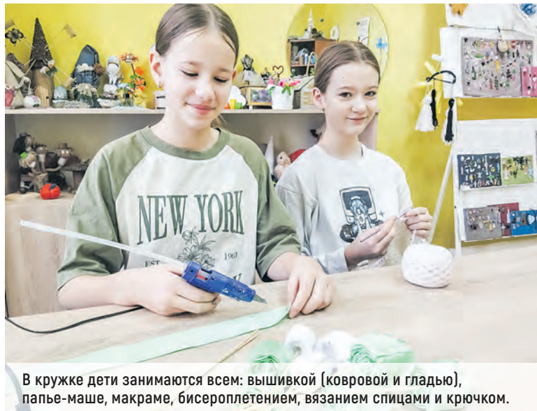
В кружке дети занимаются всем: вышивкой (ковровой и гладью), папье-маше, макраме, бисероплетением, вязанием спицами и крючком.

– Не пышные платья, а весьма простые модели, но обязательно хлопковые. Очень ценятся нату-