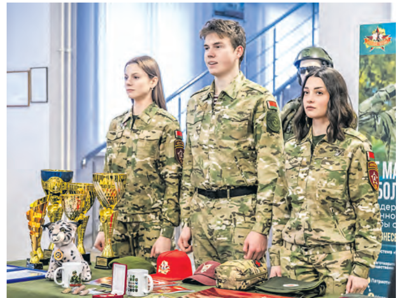
Фонд «Молодая гвардия» объединил около 3 тыс. детей в 23 военно-патриотических клубах под своей эгидой.

– Ребята осваивают образовательную программу «Подготовка