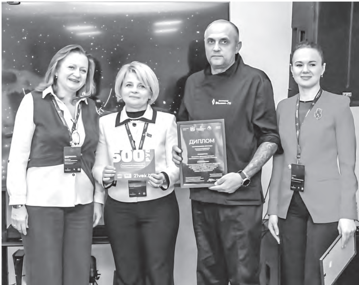
Команда санатория «Неман-72» стала одним из победителей открытого областного конкурса кулинарного и кондитерского искусства, покорила жюри изысканным террином с цукини.

белка, для которых выстраивали отдельный рацион. Готовя для мужчины с подагрой, исключили ряд продуктов от красного мяса и некоторых видов рыбы до шпината, при этом меню осталось разнообразным, – подчеркивает собеседник. – То, что полезное не может быть вкусным, – миф. Даже из ограниченного набора продуктов можно приготовить достойное блюдо.