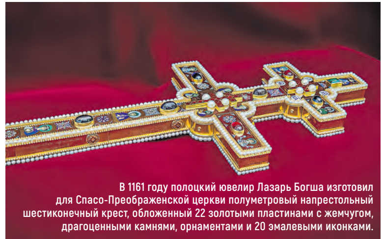
В 1161 году полоцкий ювелир Лазарь Богша изготовил для Спасо-Преображенской церкви полуметровый напестольный шестиконечный крест, обложенный 22 золотыми пластинами с жемчугом, драгоценными камнями, орнаментами и 20 эмалевыми иконками.

– Полоцкая земля является важным центром христианства и с давних времен несет благородную миссию просвещения. Наш университет по праву считается продолжателем образовательной традиции и с гордостью носит имя Евфросинии Полоцкой. Ее жизненный путь и свершения стали нравственным ориентиром, олицетворяют миролюбие, духовность, просвещенность. Преподаватели и студенты вуза на протяжении многих лет принимают участие в работе по исследованию и благоустройству Спасо-Евфросиниевского монастыря. Новые страницы ее жизни открываются совместными усилиями белорусских и российских ученых.