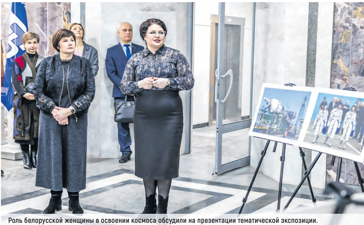
Роль белорусской женщины в освоении космоса обсудили на презентации тематической экспозиции.