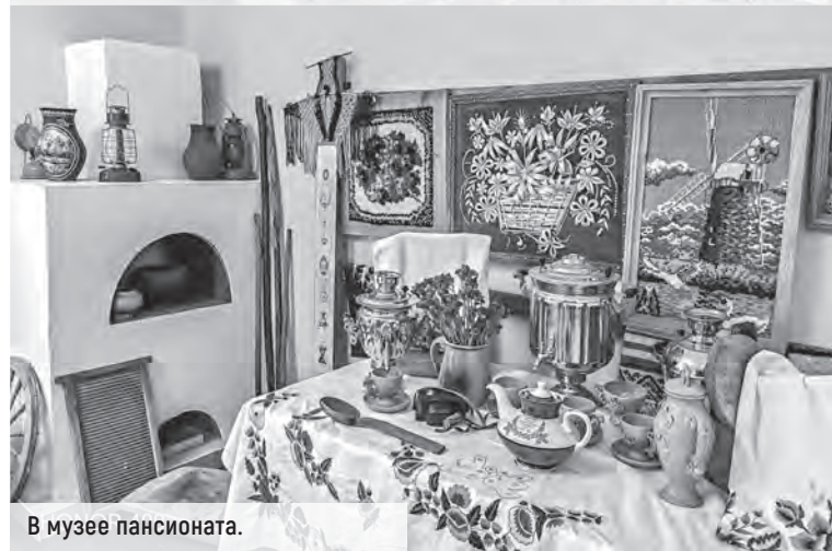
В музее пансионата.

найти занятие, которое ему будет интересно. Очень важно, чтобы люди видели результат своей работы: будь то концерт или выставка-продажа. Тот, чье изделие купили, чувствует свою значимость.